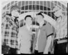
ザ・ビートルクラッシャー