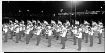
西原高校マーチングバンド