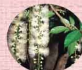
町花木・サワフジ