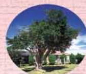
町の木・ガジマル