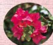
町の花・ブーゲンビリア

編集・発行/西原町役場企画財政課(広報係) 西原町字嘉手苅112番地 ☎098(945)4533 印刷/グローバル企画印刷(株)