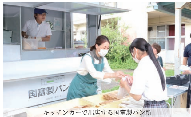
キッチンカーで出店する国富製パン所

本紙に寄せられるお便りやお問い合わせの多くに、地域のために頑張っている人のご紹介があります。今号では、7月の河川愛護月間と8月の道路ふれあい月間に合わせて、美化活動に取り組む人にスポットをあてて紹介します。取材では、活動を始めたきっかけや作業中に起きたうれしい出来事などを聞きました。今回ご協力いただいた皆さまのほかにも、日頃より善意で活動されている方は多くいます。皆さまの献身的な地域貢献活動に対しまして、心よりお礼申し上げます。また、今年もまち全体で美化活動に取り組む「クリーン国富」の実施が予定されています。主体となる各種団体、地区をはじめ、皆さまのご理解とご協力、ご参加をよろしく願います。