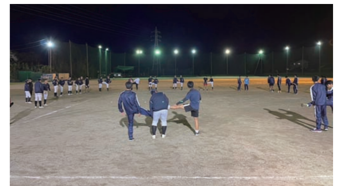
各部が連携し「チーム本庄」で行う合同練習

段として定着しました。強化指定部の顧問の皆さんに話を聞くと「何よりも大切に育んできたのは、生徒たちを安心して社会に送り出すために必要な人間力です。その次に競技力です」と信念を伝えてくれました。強みも弱みも十人十色の生徒たちが過ごす部活動。競技力は一朝一夕に向上するものではありません。指導者が伝える技術や想いが、卒業生から在校生へと引き継がれることで次第についてくるものです。そして、野球部11年ぶりの夏の