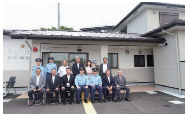
地域の治安を守るため、明治30年頃から続く木脇駐在所