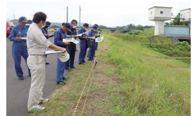
河道を確保するための工事が進められる木脇川

5月30日(火)、消防団や高岡土木事務所、陸上自衛隊などの関係機関と連携し町内の災害危険箇所の点検と意見交換会を行いました。点検では、昨年9月の台風14号で浸水被害が発生した木脇地区などを視察。木脇川の川底に堆積した土砂の撤去や堤防の竹伐採など、県が進める対策工事を確認しました。意見交換会では「地元から寄せられた被害の情報を迅速に共有してほしい」などの意見が出されました。