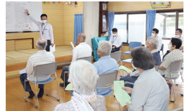
説明会後は、その場で申請手続きを行う人の姿も見られました

町の移動支援事業「デマンド型乗合タクシーよつば号」と「国富町活き行きバスカ事業」の説明会が5月31日(水)、六日町自治公民館で行われました。この日は、町職員から同事業を利用する際の留意点が伝えられたほか、参加者との意見交換や質疑応答が行われました。説明会は、町職員が各区のサロンなどに出張し行うもので、開催の要望は各区長からの連絡により随時受け付けています。