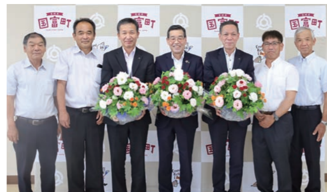
町花き振興研究会の皆さん