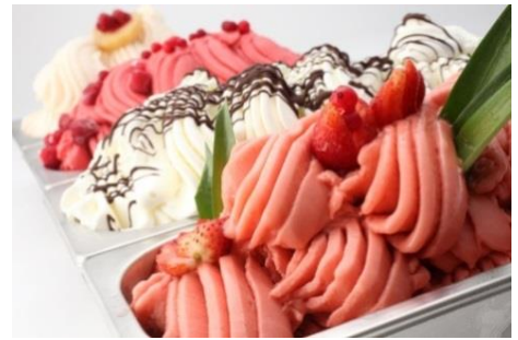
▲昨年のアイスクリーム総選挙で 1位に輝いたCAMPO SOLARE