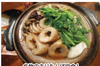
名物のきりたんぼ定食!