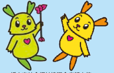
栃木市社会福祉協議会広報大使 ふつくん・びーちゃん