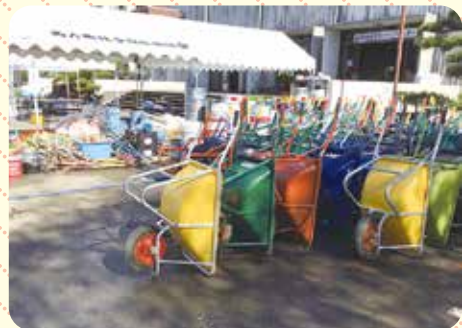
〈支える人を支える、共同募金は資機材等の購入にも活用されています〉

あなたが「あの時」協力してくださった募金の一部は、栃木市災害ボランティアセンターの運営にも活用されております。