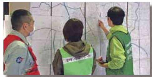
〈災害のエリアと状況の確認〉