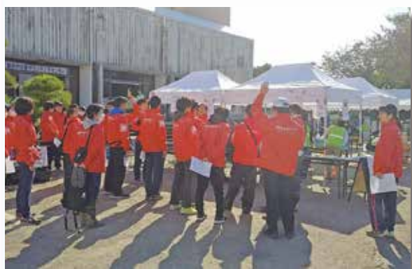
〈多くの学生ボランティアも活躍していました〉