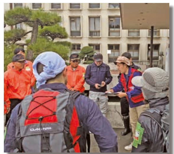
〈活動内容説明の様子〉

問合せ 栃木本所 TEL 22-4457 FAX 22-4467 大平支所 TEL 43-0294 FAX 43-0644 藤岡支所 TEL 62-5861 FAX 62-5869 都賀支所 TEL 28-0254 FAX 28-0323 西方支所 TEL 92-8080 FAX 92-8351 岩舟支所 TEL 55-2438 FAX 55-5590