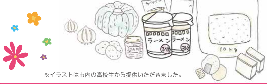
※イラストは市内の高校生から提供いただきました。