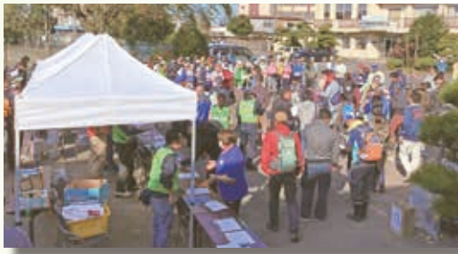
〈多くのボランティアさんが駆けつけてくれました!〉

新年が、皆様に とって、また、す べての地域におい て、災いのない、 平穏な一年となる ことを心から願ひ、 お礼といたします。