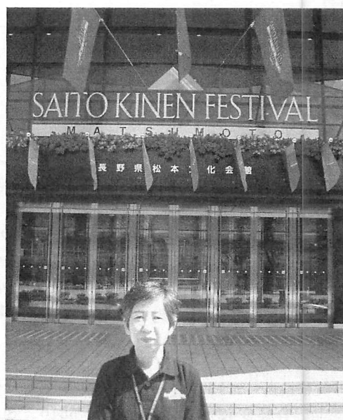
斉藤記念フェスティバル会場にて筆者