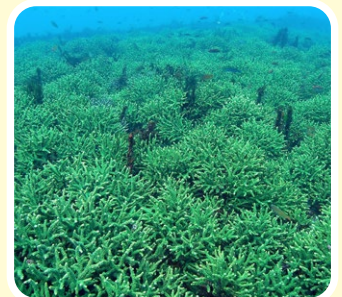
■内浦湾のエダミドリイシ群落