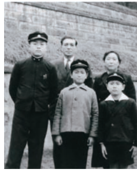
直人さん、子どもたちとともに 昭和33年ごろ