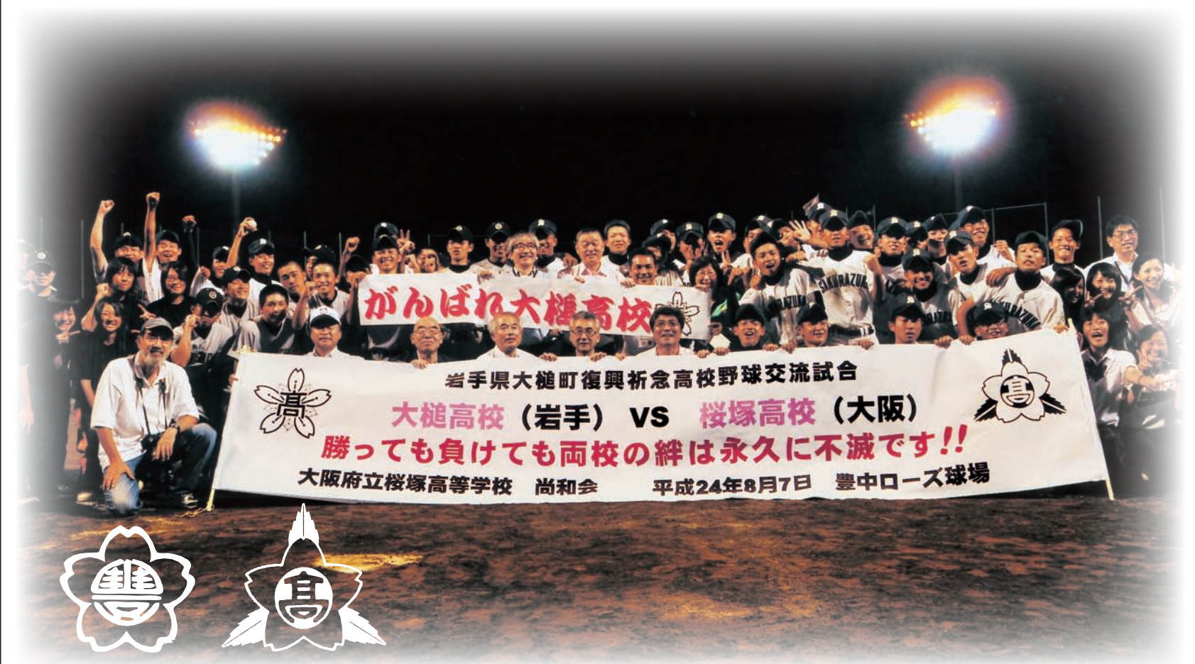
熱戦を終えて 平成24年8月7日