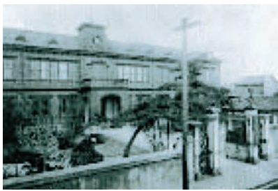
大阪府立豊中高等女学校校舎