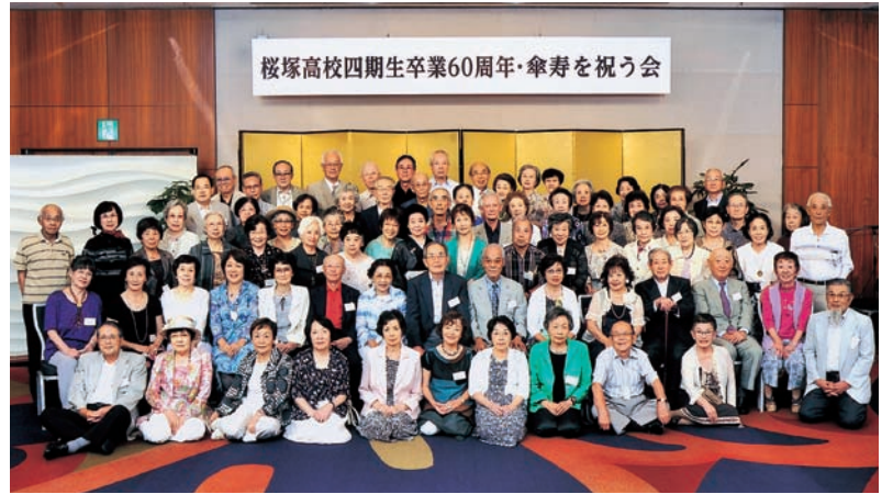
桜塚高校四期生卒業60周年・傘寿を祝う会

戦争、敗戦、次々襲う大震災、目まぐるしく変化する世の中、思えばいつも死と隣り合わせの日々だったと思えば、この長い年月は奇跡としか思えません。多くの物と人々に守られての今日は「おめでとー」の前に「有難う」