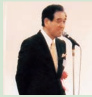
大島会長来賓挨拶