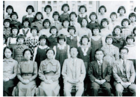
昭和16年 1年生い組写真