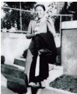
府立豊中高等女学校 (現・桜塚高等学校) 時代