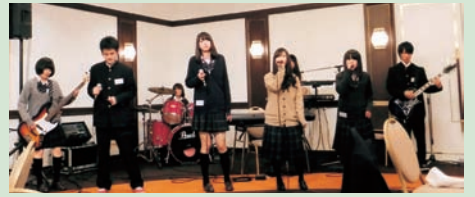
「さくらヒルズ」の演奏