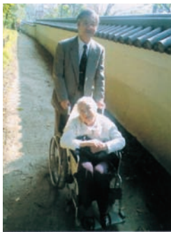
病院の帰りに後楽園で藤を見る 悪性リンパ腫の治療に東大病院に通う (平成18年ごろ)