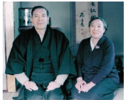
昭和45年頃 結婚30周年記念