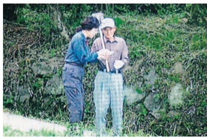
ドラマのワンシーン