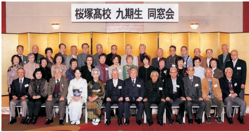
桜塚高校 九期生 同窓会

を対象とした調査で桜塚は大変好感をもって評価されたこと、震災からの復興に頑張っている岩手県立大槌高校との交流試合が話題になった野球部、各方面で活躍の軽音楽部、春の校内だけ桜観賞会などが紹介され、何かほのぼのとした校風を思い出しました。