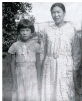
兵庫県伊丹市稲野町時代 妹のかほちゃんと一緒に