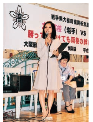
両校交流会、さくら協定締結式にて（8/6）