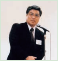
小山学校長来賓挨拶