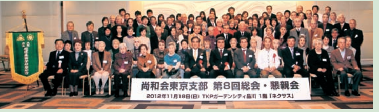
尚和会東京支部 第8回総会・懇親会 2012年11月18日(日) TKPガーデンシティ品川 1階「ネクスス」