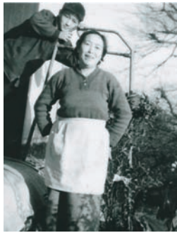
子育て時代 昭和35年ごろ