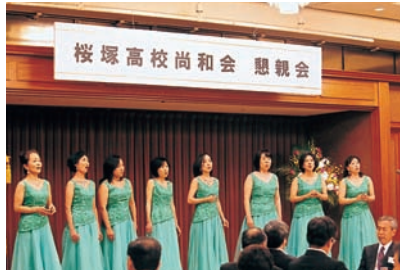
プティ・タ・プティ (女性アンサンブル)