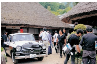
50年前の初代トヨベツクラウンも登場