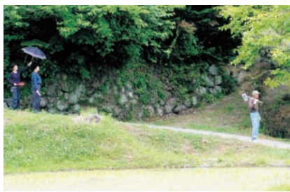
ヨーイ!! スタート前