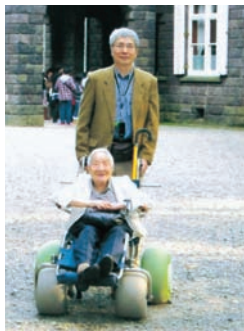
旧古河庭園でバラを見る