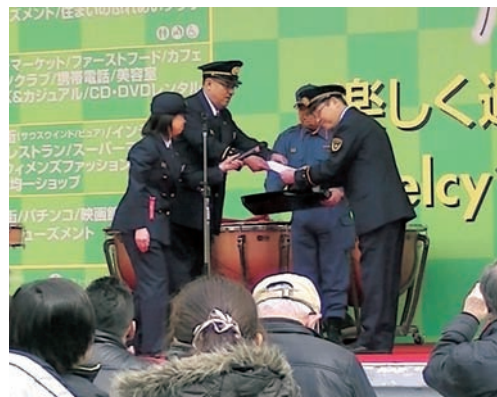
委嘱状授与 千里セルシー広場にて