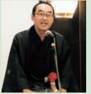
高29期山澤副会長の落語 (笑福亭仁勇師匠)