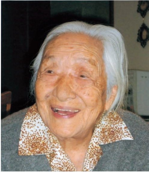
平成21年9月 目白台の自宅で