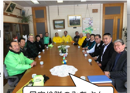
見守り隊のみなさん

年に10回の読み聞かせの会。年間204回（授業日数）の登下校の見守り。年8回のクラブ活動の先生方。また、学校にアドバイスをくださる学校評議員のみなさん。民生児童委員、主任児童委員のみなさん。各学年の総合的