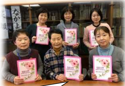
読み聞かせ隊のみなさん