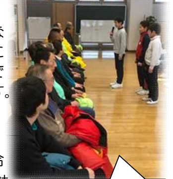
見守り隊感謝の会