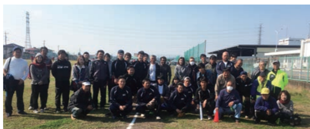
【ソフトボール大会】 ゴルフコンペ、釣り大会等も開催しております。みんなで声を掛け合いながらスポーツや趣味を楽しむことで、さらにお互いの理解が深まります。普段のチームワークが活かされます。