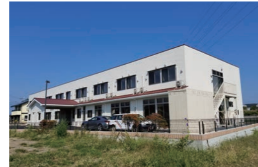
H28.4 富士見老人ホーム新築工事