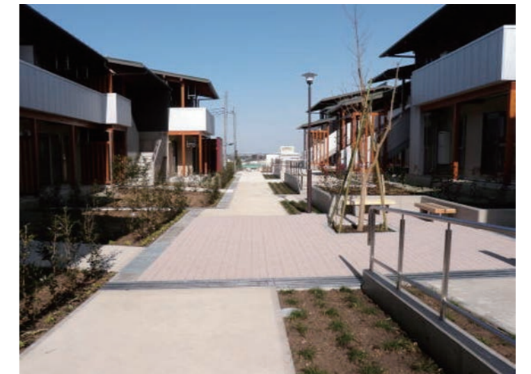
H21.5 山名市営住宅新築工事