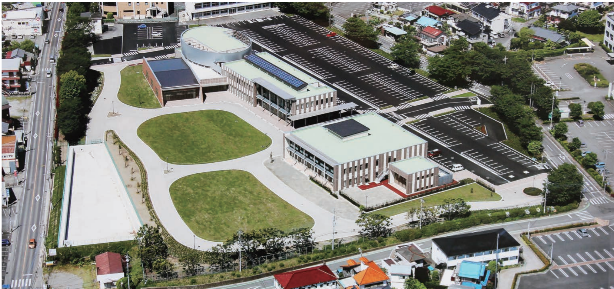
H22.11 高崎市生涯学習センターソシアス建設工事 旧建物解体、造成から建物本体・造園・外構・調整池すべて施工