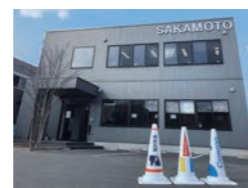
白いカラーコーンSRC