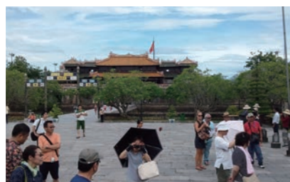
【社員旅行】 (右)平成28年度はベトナム「ダナン」へ社員旅行へ行ってきました。 (左)平成29年度は九州・ハウステンボスに行ってきました。 ※平成30年度はタイ、その後は社員の好きな所へ行きます。 家族参加、大歓迎!!