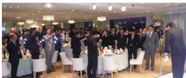
【お花見会・新入社員歓迎会・表彰式】 盛大におこないます。