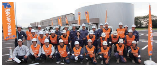
【ボランティア活動】 毎年清掃ボランティア活動をおこなっております。雪が降れば、社員全員で雪かきをおこない地域の皆様に喜ばれています。