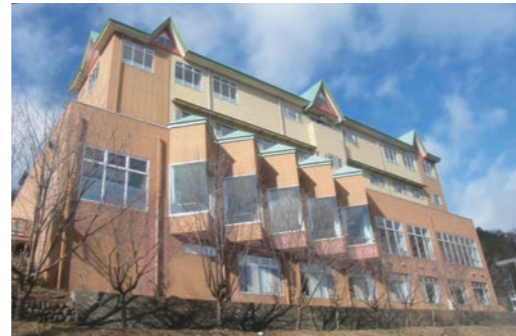
H28.3 榛名林間学校榛名湖荘