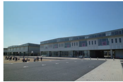
H19.9 高崎市立桜山小学校新築工事