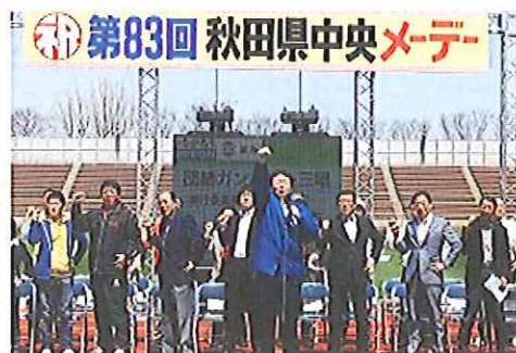
【全員で「団結ガンバロー」を三唱】

第83回秋田県中央メーデーが八橋陸上競技場で開かれた。今年は、『非正規労働者の増加・雇用・生活不安・社会保障への不安など深刻な状況下にあってもディーセントワーク（働きがいのある人間らしい仕事）が実現される社会をめざす』としたメーデー宣言を採択した。働く者の団結が復興・再生への大きな力となることを改めて確認。式典後3年ぶりにパレードを実施した。