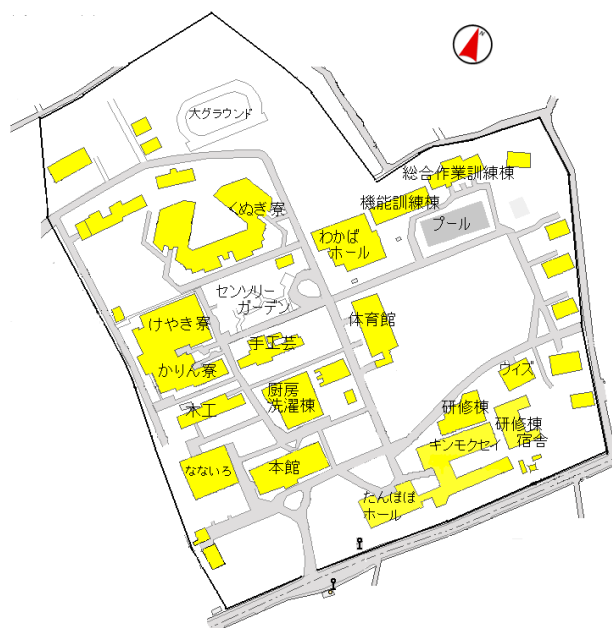
国立障害者リハビリテーションセンター 自立支援局 秩父学園 (配置図)