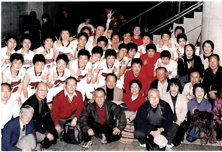
初戦終了後、桜萩会応援団と選手達（東京体育館）