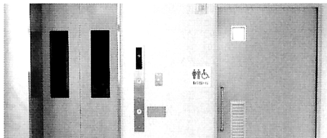
エレベーターと車椅子対応トイレ