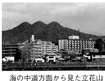
海の中道方面から見た立花山

最初に企画した立花山(367m)を紹介します。西鉄バスの下原停留所下車、立花山登山道入口の案内板が目印です。