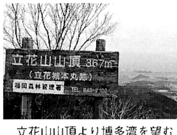
立花山山頂より博多湾を望む

山頂には立花城跡があり、博多の街を守る為に元徳二年大友貞載により築城されたと記されており、山麓には城主立花氏を祀る梅岳寺があります。山頂からの眺めは広大で、海の中道・博多湾・福岡市街等絶景です。