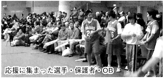
応援に集まった選手・保護者・OB