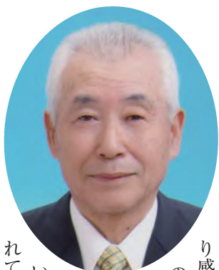
北海道青年団OB会 会長 元全国市長会副会長(元深川市長)