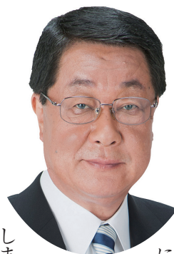
前農林水産大臣 衆議院議員