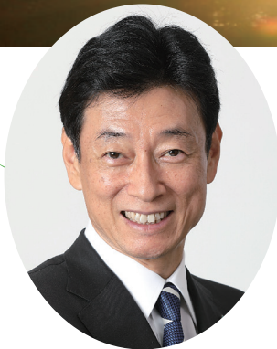
経済再生担当大臣 全世代型社会保障改革担当大臣 衆議院議員