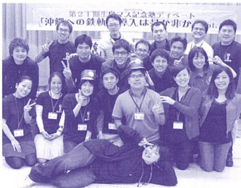
地域に貢献！人材育成！ (鳥島記念塾)