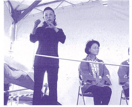
沖縄市福祉まつりで手話通訳 手の会 手話サークル