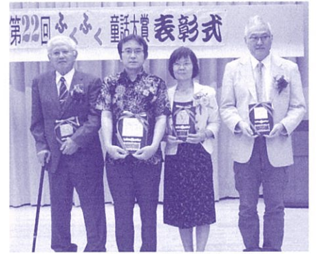
わくわくドキドキ！夢と想像力の世界へ (ふくふく童話大賞)