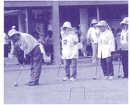
皆で楽しく健康づくり！ゲートボール大会 (沖縄市老人クラブ連合会)