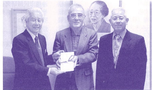
地域と企業で一体となったまつりでご協力いただきました (歳末たすけあい募金 JA コザ支店まつり実行委員会)