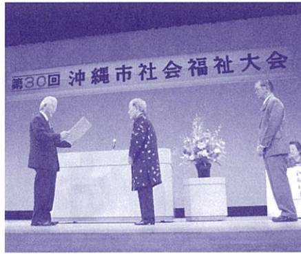
福祉に貢献された多くの方が表彰されました (沖縄市社会福祉大会)