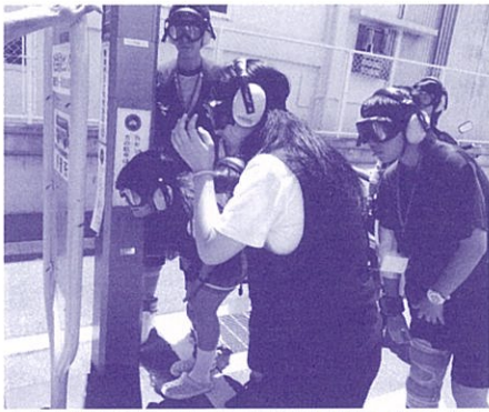
高齢者疑似体験を通して、高齢者の理解を深めよう！ (高校生サマートライアルツアー)