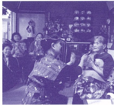
民謡で笑顔が届けられました (笑顔宅配サービス)