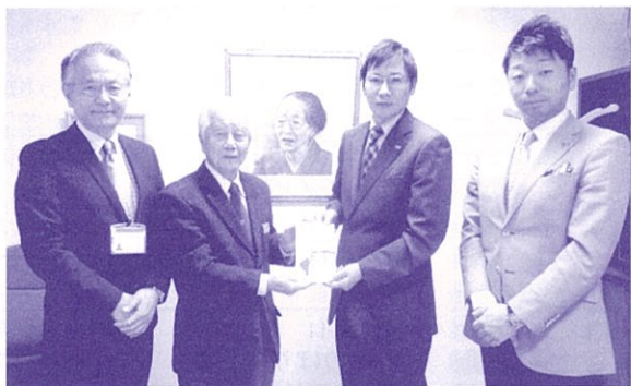
企業からも多くの善意が寄せられました (赤い羽根法人募金 日本テクノ(株))