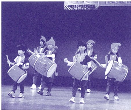
沖縄の文化継承！沖縄市子ども文化芸能まつり (沖縄市青少年育成会議)