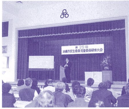
地域のために学ぶ民生委員・児童委員さん (沖縄市民生員児童委員協議会)