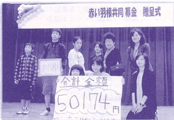
沖縄市内の児童生徒から思いやりの心が届きました (赤い羽根学童募金 安慶田小学校)

今号には、『赤い羽根共同募金』『歳末たすけあい募金』『災害義援金』にご協力いただきました皆様の名簿を掲載させていただきました。