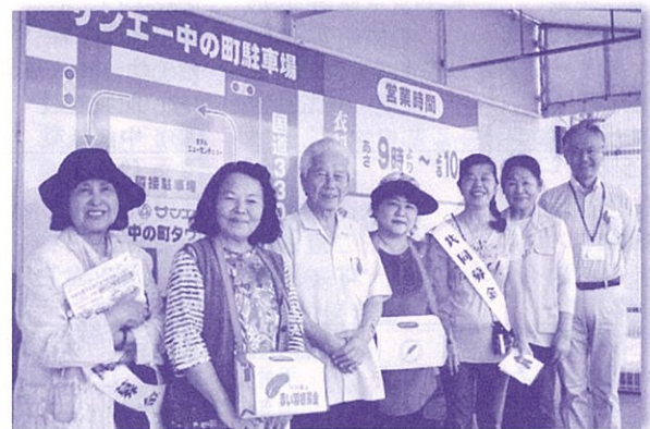
買い物ごてら、多くの方が立ち止まってくれました (赤い羽根街頭募金 胡屋婦人会)