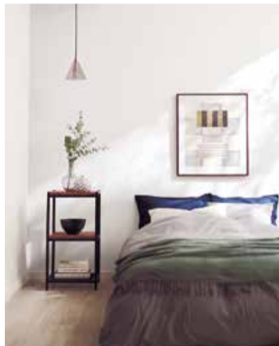
「ファブリーズ壁紙」の施工イメージ

トキワ産業は、デザイン性の高い商品から住まいに役立つ機能性商品など収録した壁紙見本帳「PINEBULL」（P&G社）とコラボした「ファブリーズ壁紙」をラインナップした。