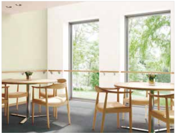
「トルウイルスS」施工イメージ