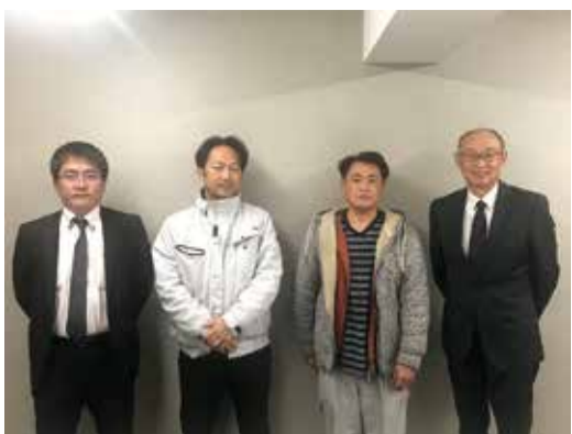
左から氏家氏、杉森氏、林会長、鈴木理事長 戸嶋氏はリモートで参加