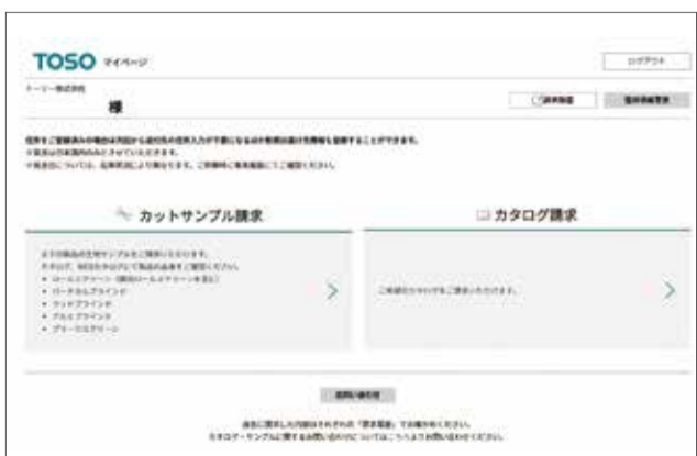
「ビジネスオンラインサービス」の画面

トソーは、ビジネスユーザー向けに、ブラインドやロールスクリーンなどの尺角サンプル、カタログを取り寄せる際に便利な「ビジネスオンラインサービス」を公開した。