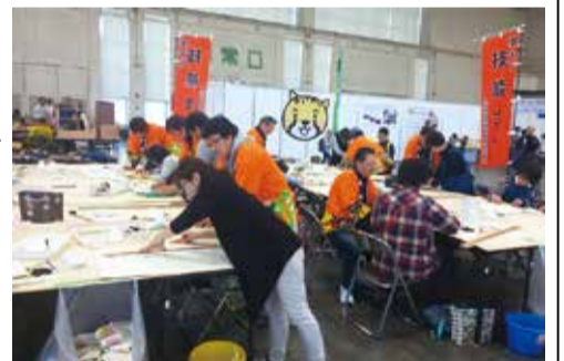
「あいち技能プラザ」の様子