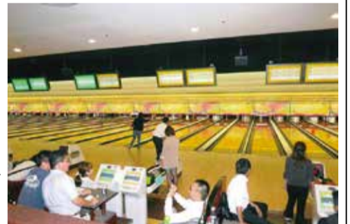
ボウリング大会の様子

一つを任せるとい手法は、非常に参考になるのではなからうか。残念ながら大運動会は会場の取り壊しによって平成9年を最後に行われ