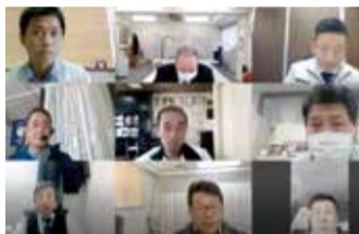
リモート会議の様子

日装連では、1月21日（木）13時半より日装連会議室において青年部・次世代委員会を開催した。今回も前回同様、コロナウイルス感染のリスクを考慮し、Zoomを使用している。日装連会議室を開催場所として、その他の委員は各々Zoomでの参加となった。 最初に椎津担当副理事