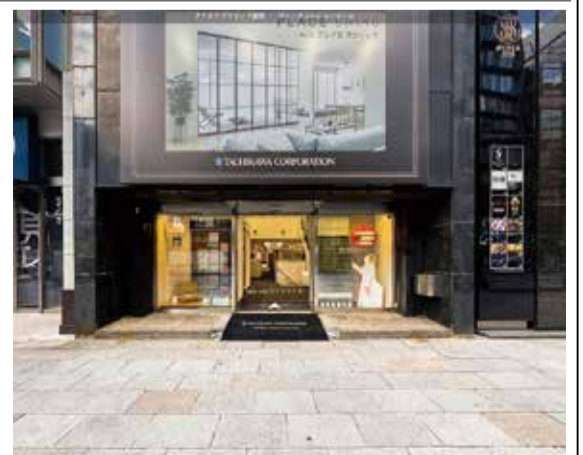
バーチャルショールーム入口

立川プラインド工業は、「タチカワブラインド銀座ショールーム」の館内をパソコンやタブレット、スマートフォンで体感できる「バーチャルショールーム」を、同社ホームページにて公開した。ページには公開した。バーチャルショールームでは、360度のパノラマビューで、ブラインドやロールスクリーンなどの窓まわり製品の紹介や操作方法の動画がみられる。