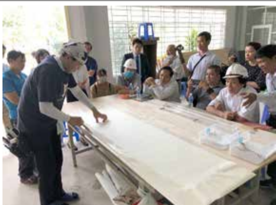
昨年2月にベトナム・ホーチミンで行った「実技試験デモンストレーション」

った。1月28日に行った座学では技能テキスト「壁装」を用いて、内装仕上げの基本的な知識を教え、続く1月29日・30日では技能検定台を使用した壁装の基本技能を教示した。参加者は熱心に学び、内装仕上げ業への関心は高まった。