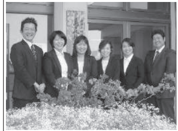
前期研究員の皆さん

◇幼稚園・こども園臨任教諭研修会 (5月16日、6月22日、9月15日、9月28日)