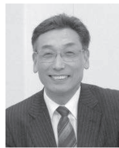
杉田洋國學院大教授

今年度の教育講演会は、10月16日(月)南風原町中央公民館黄金ホールにて國學院大学教授杉田洋先生をお招きして開催いたします。演題は、「特別活動の充実で子どもを変える学校を変える」で子どもを変える学校を変える教育課題解決への挑戦(仮題)です。