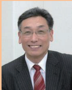
杉田洋(國學院大学教授)

日時 平成29年10月16日(月) 場所 南風原町中央公民館黄金ホール 時間 15:00~17:00 講師 杉田洋(國學院大学教授) 演題 特別活動の充実で子どもを 変える学校を変える ~教育課題解決への挑戦~ 入場無料 多くの皆様のご参加を!!