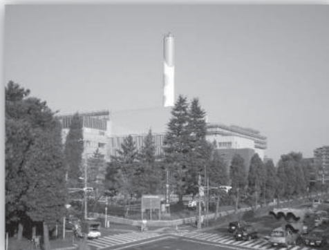
東京都世田谷区にあるごみ焼却施設

施設の周囲は住宅街や幹線道路が通っており、まさに街のど真ん中にあるごみ焼却施設なので、臭気対策として敷地内に緩衝緑地の設置や、ごみ搬入時にパッカー車が周囲の一般道路で渋滞するのを防ぐため、敷地内のパッカー車の周回路を長く設計（施設入口からごみ投下ピットまで大回りする）するなど様々な工夫を行っている。