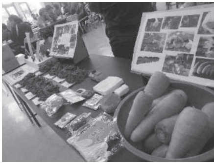
一年間の活動成果を展示

島尻地区内小中学校（糸満市・豊見城市を除く）に在籍し、「しののめ教室」における指導が望ましいと判定された児童生徒が対象となります。