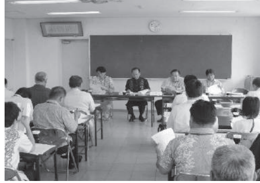
当組合と三清掃組合職員、構成市町村職員との会議の様子