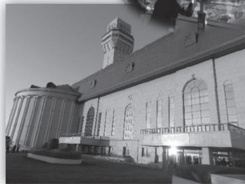
埼玉県越谷市にあるごみ焼却施設

「良い建物にしてほしい」と住民からの要望で、ヨーロッパの古城をイメージしたデザインの施設は地域のランドマークとなっている。また、ごみ焼却施設に必要な計量機、洗車場、待機車路などを建物内に収めた構造なので、パッカー車がごみを搬入する時の一連の作業が施設の外から見えず臭気対策や周囲の景観への配慮にも工夫をしている。さらに、煙突には展望台（高さ80m）を設けて住民に無料開放しており、遠くに富士山や東京スカイツリーも見ることが出来る。また、元旦には初日の出を見るため多くの人を訪れる人気スポットとなっている。