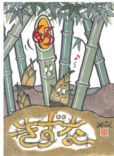
京都西ロータリークラブ65周年記念 遊墨漫画家 南久美子氏作「きすな」

<例会日・場所> 月曜日 12:30～13:30 リーガロイヤルホテル京都 <事務所> 〒600-8237 京都市下京区東堀川通塩小路下ル松明町1番地 リーガロイヤルホテル京都4階 TEL(075)361-1006 FAX(075)341-0841 <ホームページ> http://www.kyotowest-rc.jp/ <メールアドレス> kwrc@kyotowest-rc.jp 創立 1958年2月3日 クラブカラーは茜色