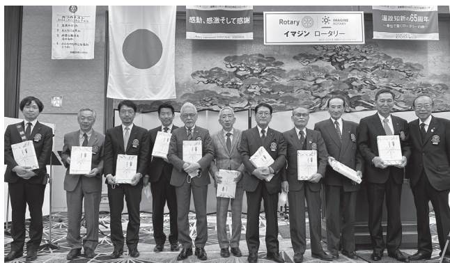
12月5日 12月会員誕生日お祝い