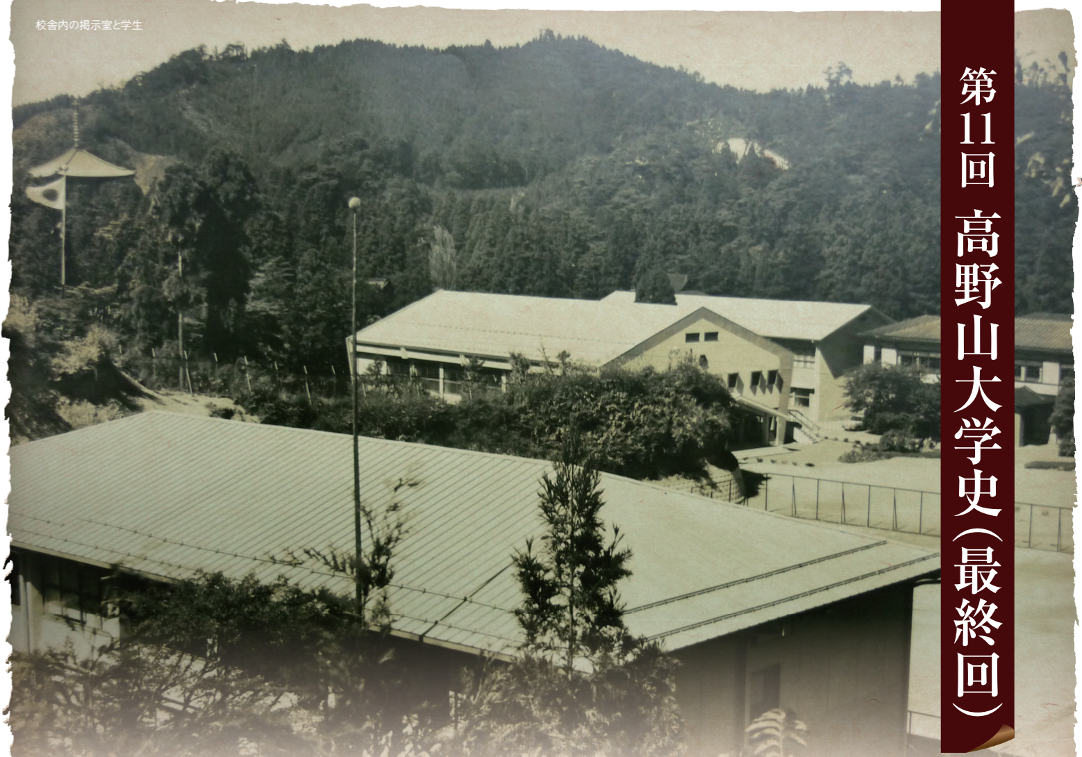
校舎内の掲示室と学生