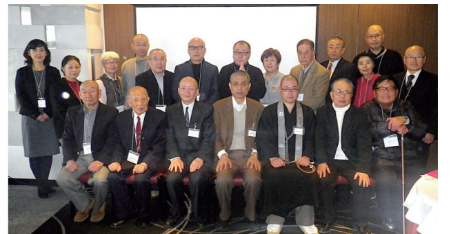
大学院通信教育課程支部総会

平成29年11月18日(土)午後3時から大阪梅田の阪急27階の「グランド白楽天」において、大学院通信教育課程支部総会を開催し、19名が参加しました。