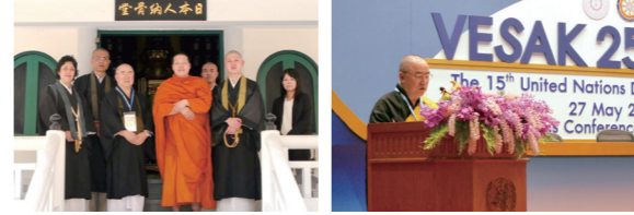
日本人納骨堂にて