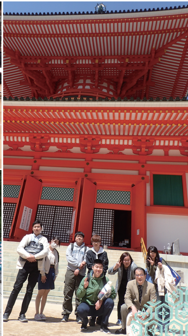
(上)入学式での新生宣言 (下)新生奥之院廟参