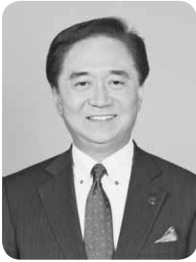
神奈川県知事 黒岩 祐治