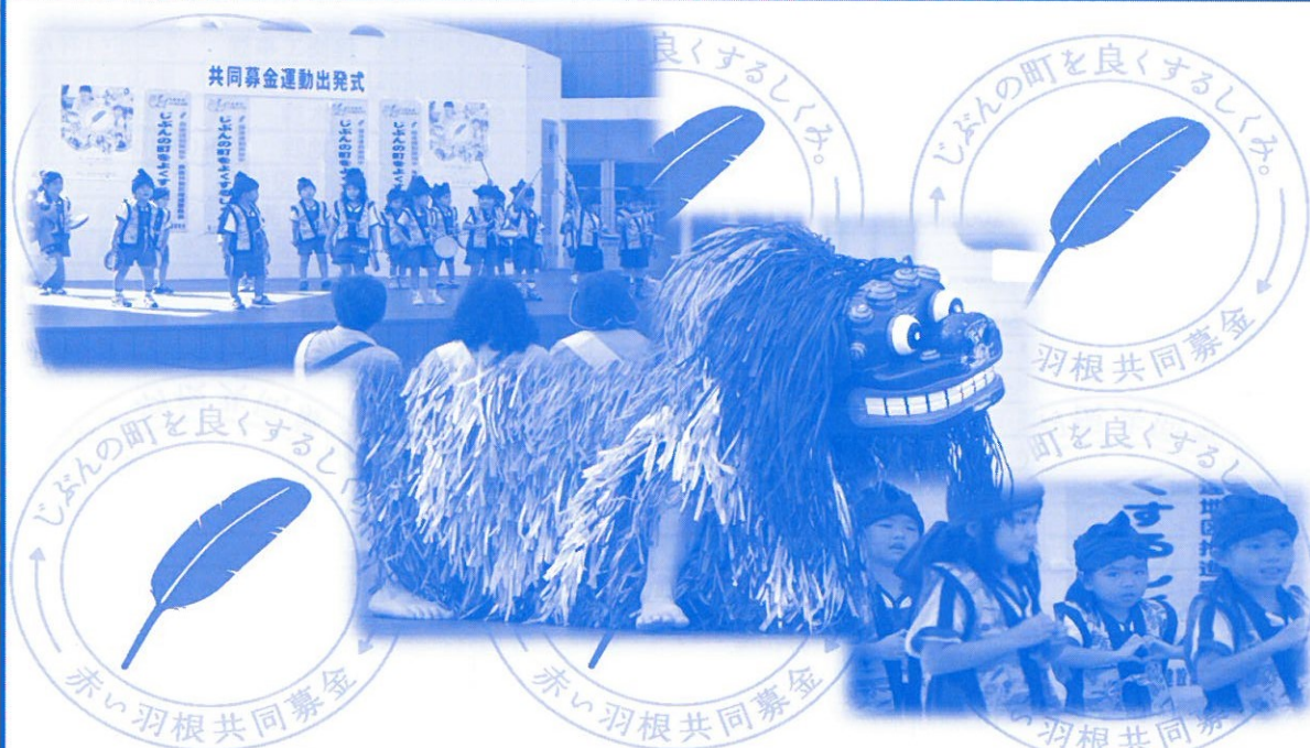
平成26年度 共同募金運動出発式のにじの色保育園児によるアトラクションの様子

平成26年度の共同募金運動に際しましては、ご協力いただきました市民の皆様や市内外の商店・事業所及びその従業員の皆様など、多くの浄財をいただきましたこと、募金活動にご尽力いただきました各自治会の関係者やボランティアの皆様方に対しまして、心から感謝を申し上げます。