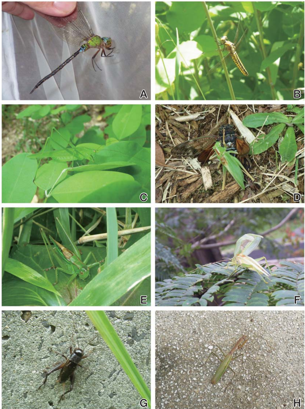
図3 宍道湖グリーンパークの昆虫類(1).

A, カトリヤンマ (2013.10.8) ; B, ハラビロトンボ (2013.5.23) ; C, ツユムシ (2013.10.8) ; D, アブラゼミを捕食するヤブキリ (2013.7.27) ; E, ニシキリギリス (2013.7.27) ; F, アオマツムシ (2013.10.8) ; G, エンマコオロギ (2013.10.8) ; H, チョウセンカマキリ (2013.10.8).