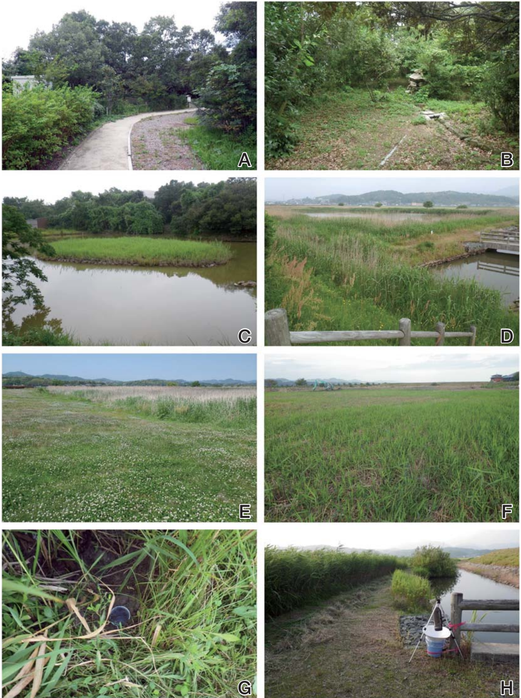
図2 調査地の環境写真 (2013年撮影)。

A-C, 宍道湖グリーンパーク園内 (A-B, 植樹の様子; C, 園内の池); D-H, ビオトープ池 (D, 南東側より撮影; E, 西側より撮影; F, 草刈り後の様子; G, ビットフォールトラップ; H, ライトトラップ)。