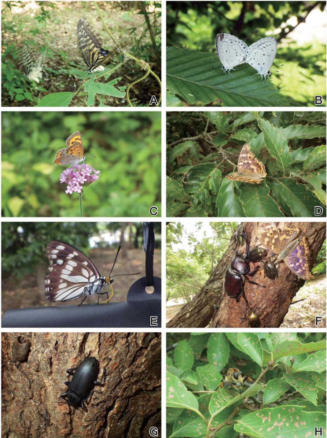
図5 宍道湖グリーンパークの昆虫類(3).

A, ナミアゲハ (2013.7.27); B, ルリシジミ交尾 (2013.7.27); C, ベニシジミ (2013.10.8); D, コムラサキ (2013.7.27); E, ゴマダラチョウ (2013.7.27); F, 樹液に集まるカブトムシなど (2013.7.27); G, ユミアシゴミムシダマシ (2013.7.27); H, シオヤアブ (2013.7.27).