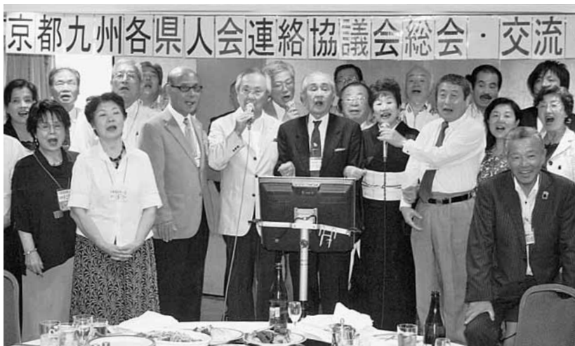
盛り上がる参加者

京都九州各県人会連 京区の京都ロイヤルホテル協議会の総会・懇親会が9月2日(日)、中