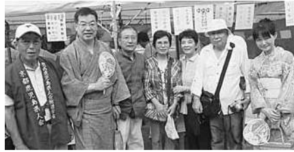
鹿児島のみなさん