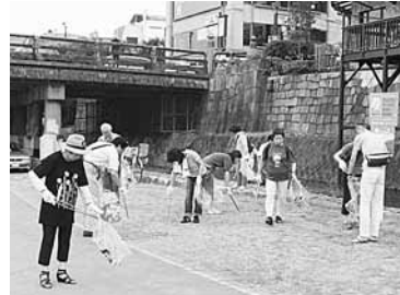
ゴミ拾いに汗を流す参加者

ふるさと連からも、鴨川納涼に出店された川納涼の会員の皆さんが参加、他の団体や学生らとゴミ拾いに汗を流しました。ゴミが少なくなつたといわれる鴨川河川敷ですが、参加者たちが熱心にゴミ拾いをしました。何かとお忙しい日、時間帯にもかかわらず参加された会員の皆さん、