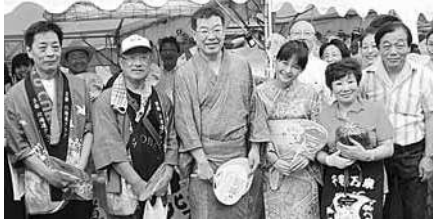
北海道のみなさん