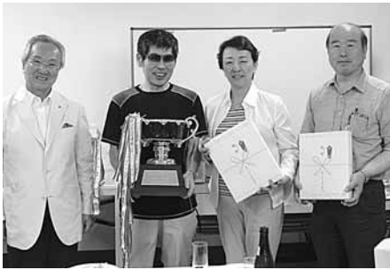
団体優勝・よかつペチーム(茨城・右3人)