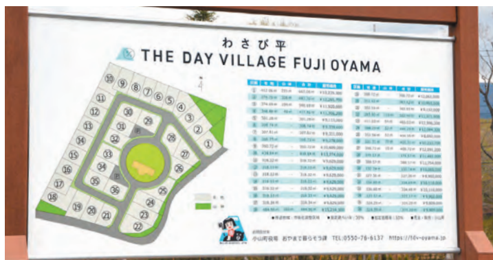
▲THE DAY VILLAGE FUJI OYAMA の区画図