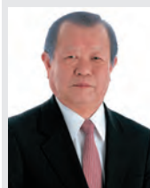
込山町長 から ひと言