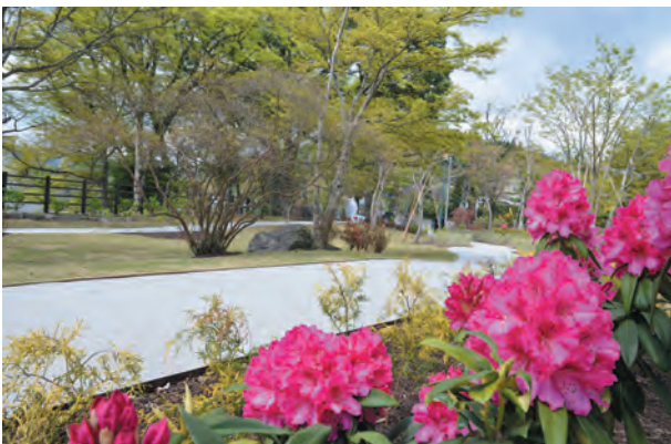
▲豊門公園内を巡る、花咲く周回路