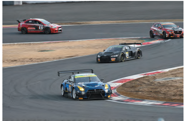
▲国内では10年ぶりとなる24時間レース

町では、この24時間レースをおやまの代表的なイベントとして、日本を代表するサーキットレースに育てることで町の活性化につなげ、モータースポーツのまちづくりを進めていきます。