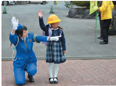
▲「右、左、よく見て横断歩道を渡ってね」

新年度が始まり、1か月が過ぎました。だいぶ、新しい生活に慣れてきたころだと思います。生活のリズムが整い、体と気持ちが安定し、新しい生活の楽しさを感じられるようになってきたことと思います。一方で、緊張感が解け、気の緩みが生まれる時期でもあります。5月は、1年間の中で、交通事故が非常に多い時期です。ちょっとした慣れ、気の緩みが、ふとした瞬間に事故を生んでしまうのかもしれない。常に緊張していることは難しいことかもしれませんが、命に関わることには、十分注意を払えるような習慣を身に付けさせたいものです。そのためにも、子どもたちが外に出る時には「ヘルメットをかぶったかな？」