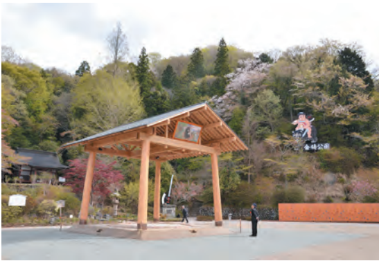
▲待望の土俵！ 5月3日の金太郎春まつりで土俵開き

町は、世代を超えたさまざまな人が集い、交流ができるように「金時公園」をリニューアルし、4月14日に開園式を行いました。公園内には、休憩したり、子どもを遊ばせたりできる「富士山—金時材」を使用した多世代交流施設