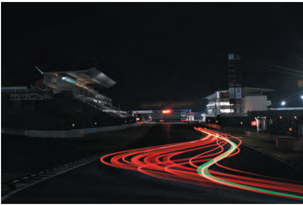
▲普段見ることのできない夜ならではのレース風景(イメージ)

スーパー耐久シリーズ「富士SUPER TEC 24時間レース」が、6月1日(金)から3日(日)にかけて、富士スピードウェイで開催されます。町では昨年12月に富士スピードウェイ、町内の観光・産業関係団体、地域住民などによる「小山町モータースポーツ協力会」を立ち上げました。