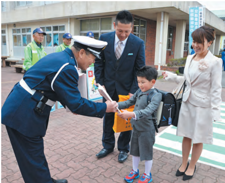
▲交通指導員さんから「道路を歩く時は、自動車に気をつけてね」