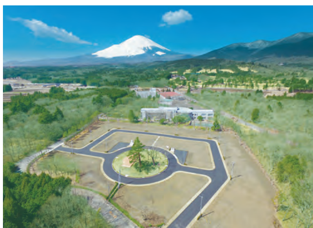
▲わさび平分譲地から富士山を望む

平成24年度から整備を始めた町の宅地分譲地は、須走緑ヶ丘(14区画)、大胡田のヒルズ銀杏(6区画)、南藤曲のクルドサック16(16区画)、用沢のヒルズYOUSAWA(19区画)の4つの住宅地で、平成29年度までに計55区画すべてが完売しています。これらの住宅地は比較的既存集落に近い場所でしたが、平成30年3月、緑に囲まれた用沢の