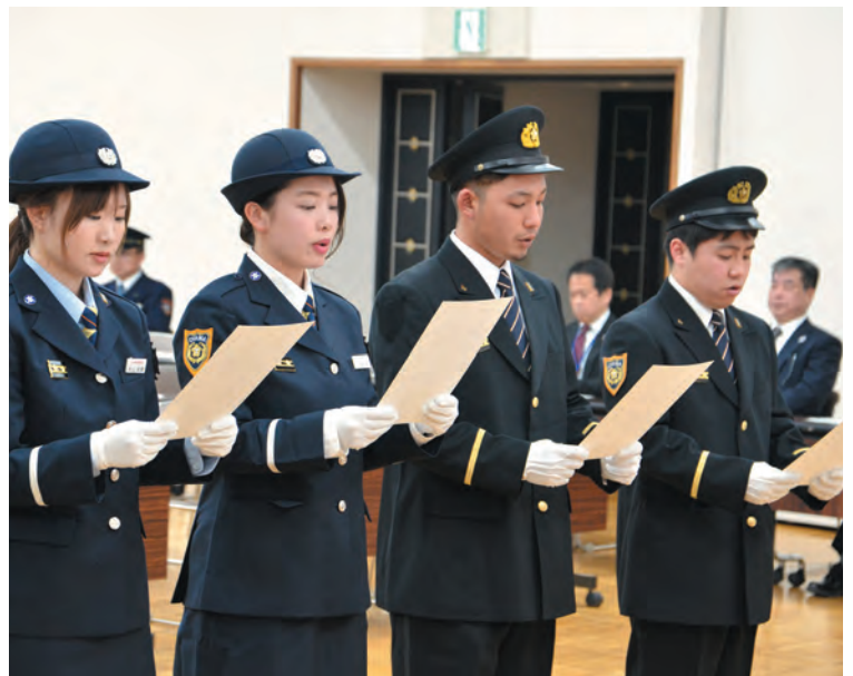
▲宣誓する新入団員

また、新役員などが任命され、新体制のもとで、おやまの安全・安心が守られていきます。