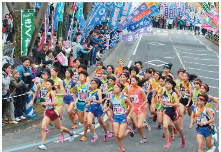
▲第18回大会スタートの様子