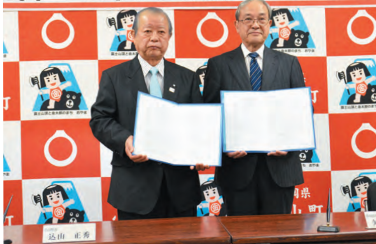
▲協定を交わした込山町長(左)と矢野弘典理事長