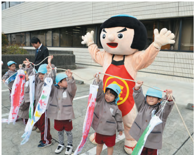
▲「見て見て! ぼくのこいのぼり!」

園児が掲揚されたこいのぼりを見上げながら童謡「こいのぼり」を歌うと、大小さまざまな100匹余りのこいのぼりは風を受けて、力強く泳ぎ出しました。