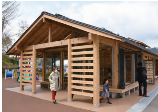
▲多世代交流施設「金太郎テラス」

設「金太郎テラス」を建設。この他にも公式競技を行える屋根付きの常設土俵や長さ44mのローラーすべり台、ボルダリングボード、駐車場などを整備しました。