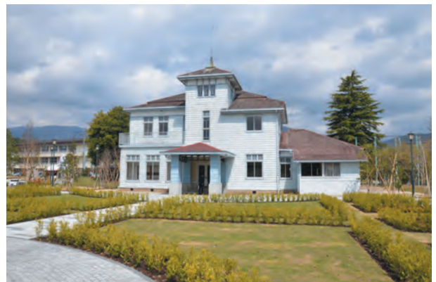
▲緑豊かに、装い新たに。際立つ西洋館