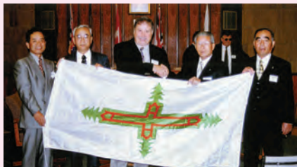
▲調印後ミッション市旗を前に握手を交わす両首長

7月 中・高校生 3人がミッション市を訪問 Jul. 3 students visited Mission