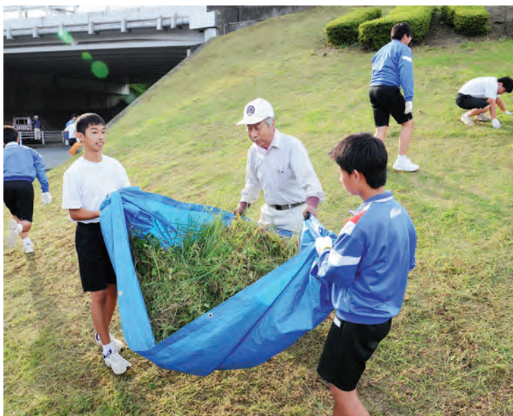
▲力を合せて地域を美しく