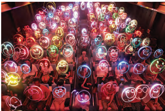
▲楽しいPiKA PiKAに参加しよう!

第2部 ワークショップ 15:30～17:00 ①PiKA PiKAワークショップ「スタジオタウン小山」のモーションロゴを作ろう 対象 6歳以上の町民 先着30人 (小学生以下保護者同伴) ②みんなで作ろう、小山町ストップモーションアニメ 対象 高校生 先着10人(2人5組) ③撮影現場の裏話トークショー ※①と②はいずれも事前申し込みが必要 (メールで下記に申し込む) 町長戦略課：chiiki@fuji-oyama.jp