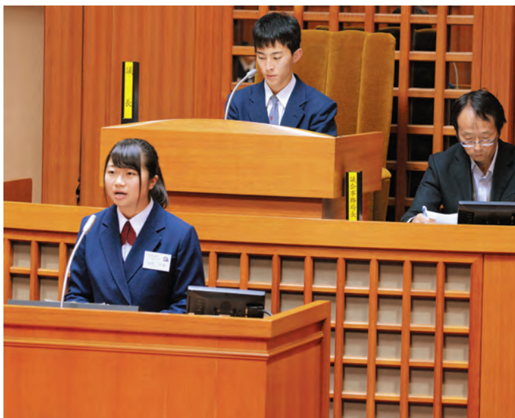
▲まちづくりについて質問をぶつける小山高生