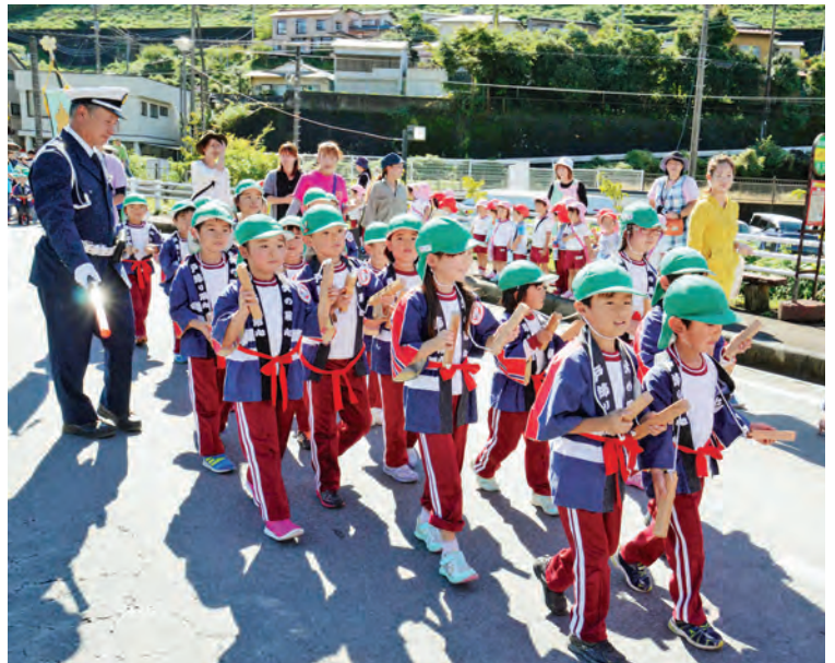
▲町内幼稚園、保育園、こども園の年長児が参加

このパレードは、火災予防と交通安全を呼び掛けると共に、参加者、沿道の住民の防火と交通安全に対する意識を高めることが目的です。園児らは、太鼓や拍子木 ひょうしき に合わせて、大きな声で「火の用心」「車に気をつけるよ」とパレードしました。