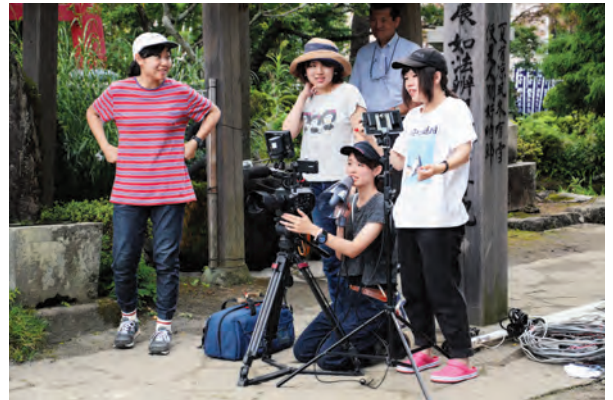
▲竹之下の宝鏡寺で (多摩美術大学生)