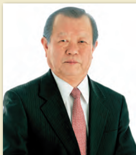
小山町長 込山 正秀 Mayor Masahide Komiyama

平成8年(1996年)10月7日に、小山町とカナダのミッション市がミッション市議場において姉妹都市提携の調印をしてから、今年で20年となりました。