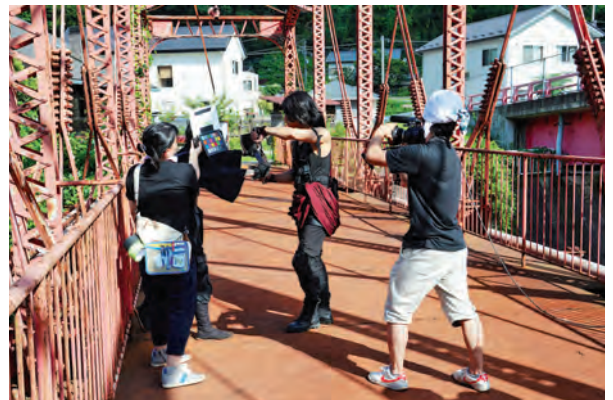
▲森村橋の上でアクション (大阪電気通信大学生)