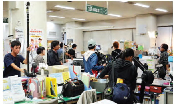
▲新春ドラマ「君に捧げるエンブレム」役場内ロケ風景 フジテレビ系で平成29年1月3日放送