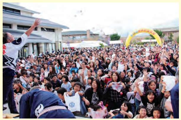
▲ 第35回金時祭のようす(金時餅投げ)

姉妹町岡山県勝央町からこんにちわ! たくさん笑顔が集う 第35回金時祭 10月8日、9日の2日間、第35回金時祭が開催されました。 8日は、おやまファーマーズ・マーケット ノースヴィレッジの芝生広場に特設ステージを設置し、ダンス・音楽イベントを開催し、町内外から、ダンスチームとバンドが参加しました。子どもたちの大人顔負けのダンスや、パワーあふれるバンド演奏で、会場は大いに盛り上がりました。 9日は、勝央文化ホールとその周辺を会場に行われ、勝央金時太鼓、きんとくんサンバ大会、ふるさと総踊り、昭和のくるま展など多彩なイベントが行われ、大勢の人がそれぞれに秋の一日を楽しみました。 また、9日の夜には金時花火大会が行われ、秋の夜空を彩る3,500発の花火が金時祭のフィナーレを飾りました。