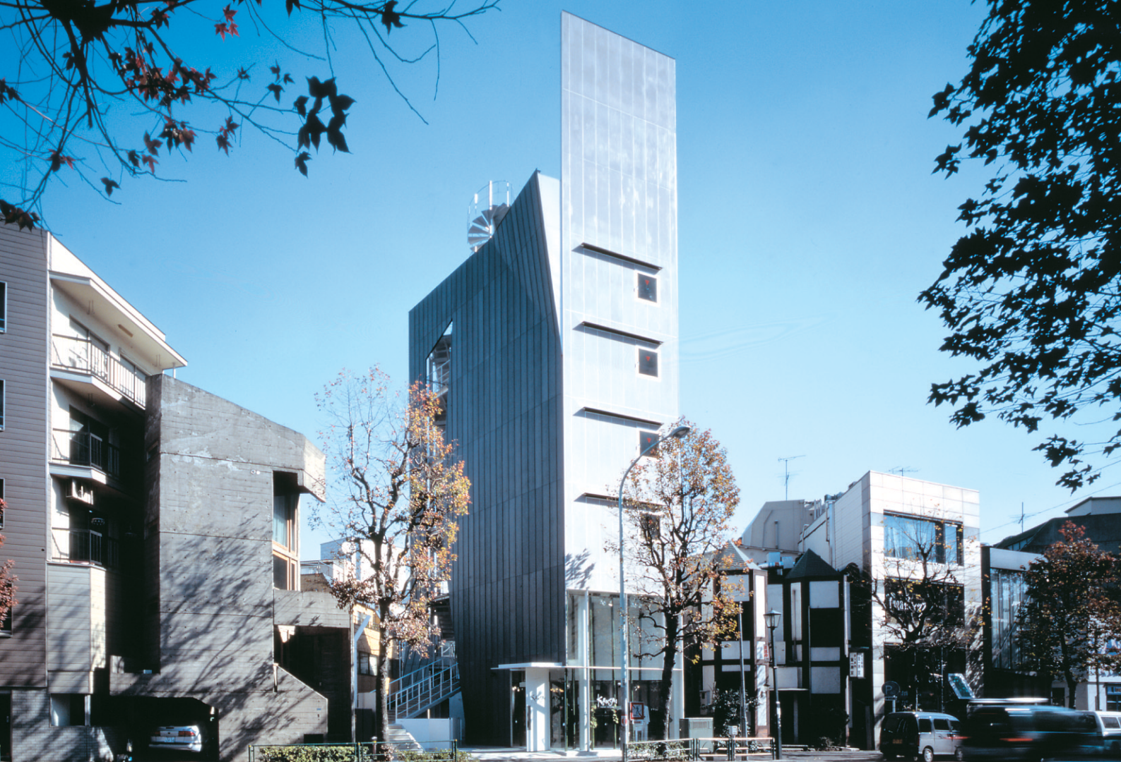
寛齋スーパービル（東京都）／工法：ハーバーストロングルーフ385 DAIMARU（山梨県）／工法：ハーバーストロングルーフ300C