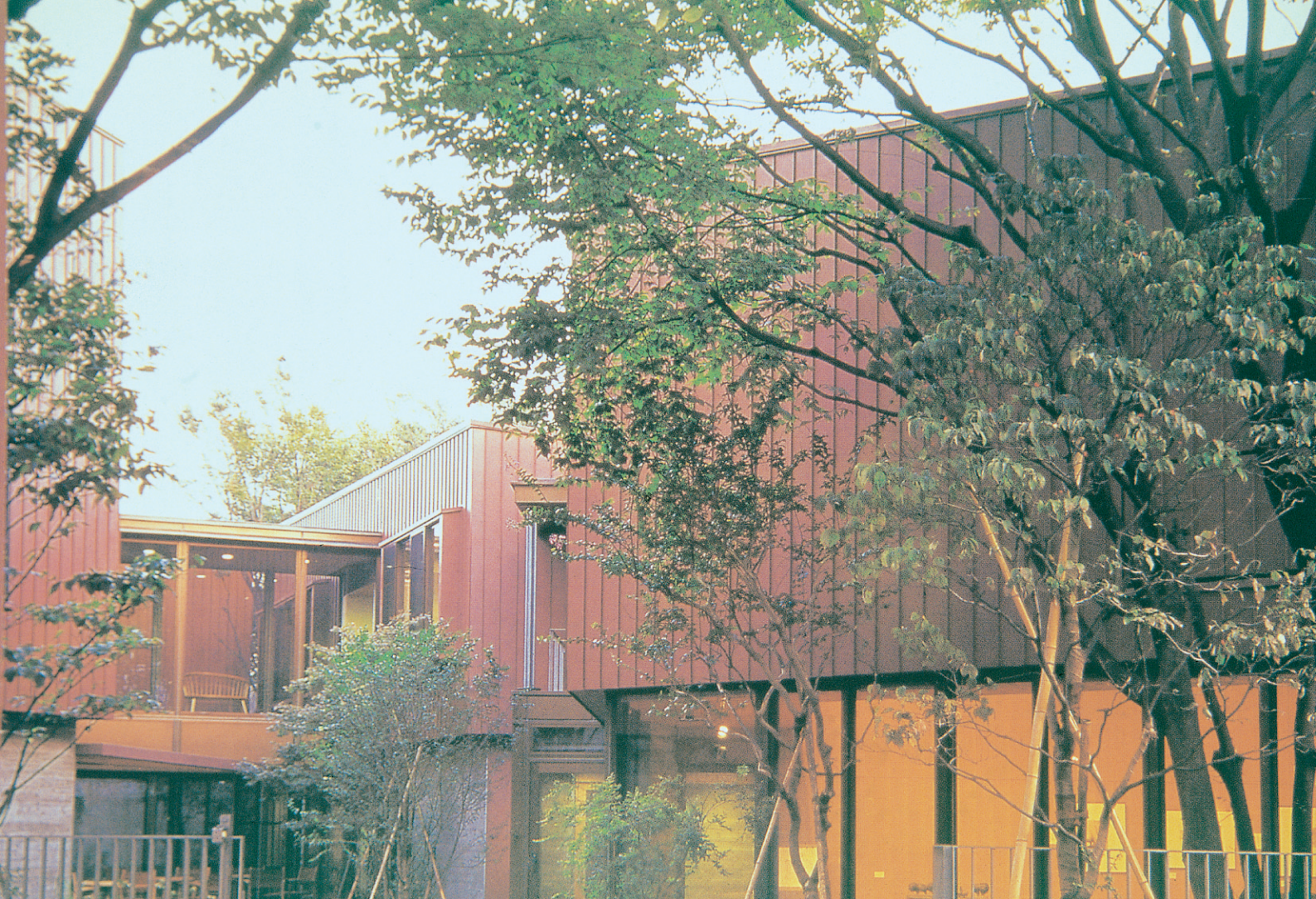
ちひろ美術館（東京都）／工法：ハーバーストロングルーフ特注型