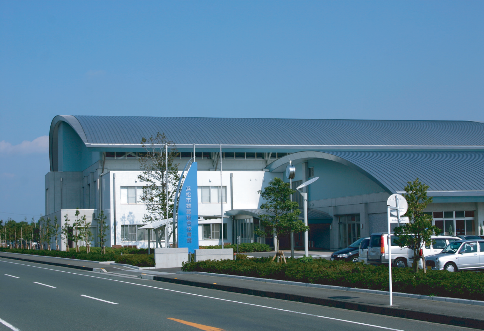
浜松市雄踏町総合体育館（静岡県）／工法：ハーバーストロングルーフ385 伊丹精米 埼玉工場（愛知県）／工法：ハーバーストロング300C