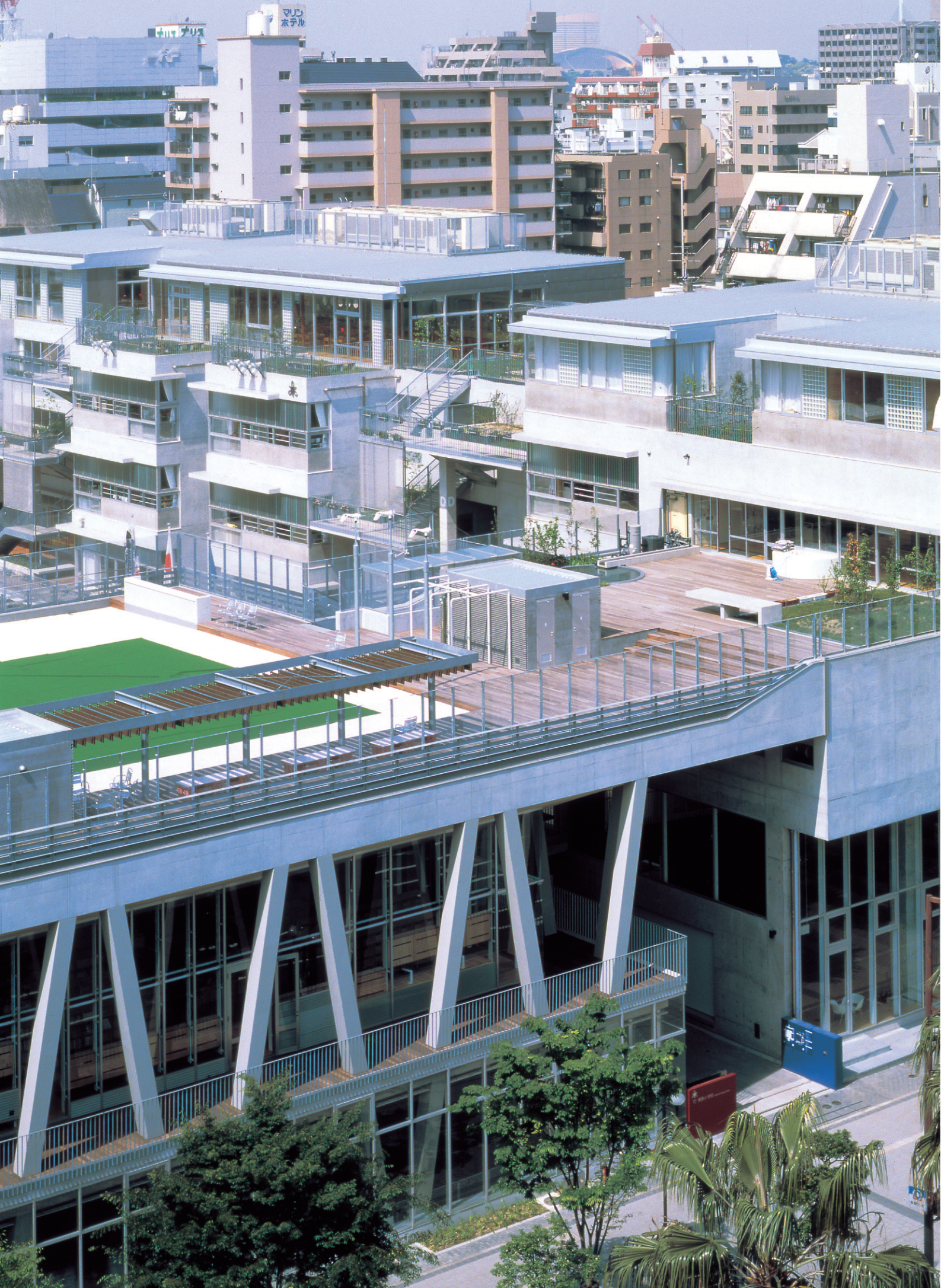
博多小学校（福岡県）／工法：ハーバーストロンググループ300（ジंकロン 断熱・遮音・防露工法）