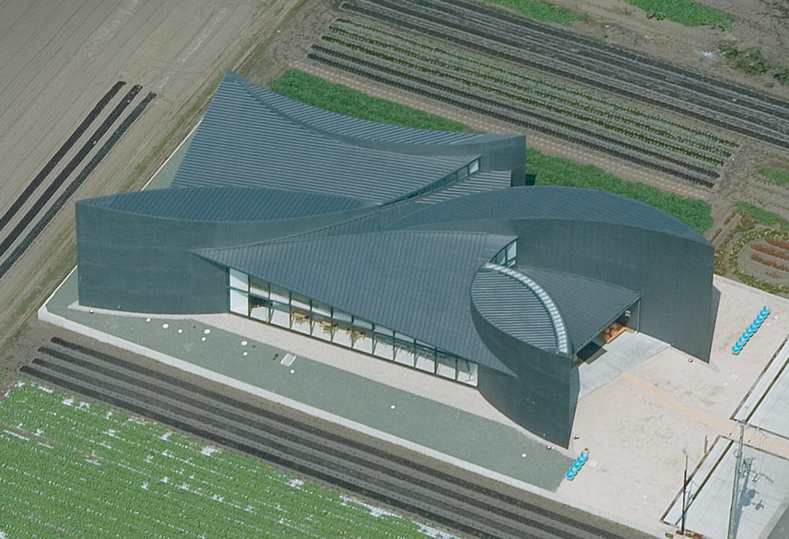
たいさんじ風花の丘（滋賀県）／工法：ハーパーストロングルーフ300 爽風会 佐々木病院（千葉県）／工法：ハーパーストロングルーフ300