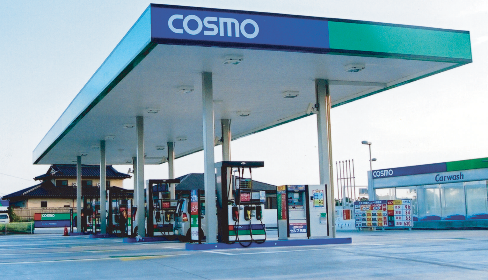
コスモ石油給油所（千葉県）／工法：ハーバーストロングーフ300C JOMO給油所（愛知県）／工法：ハーバーストロング300C