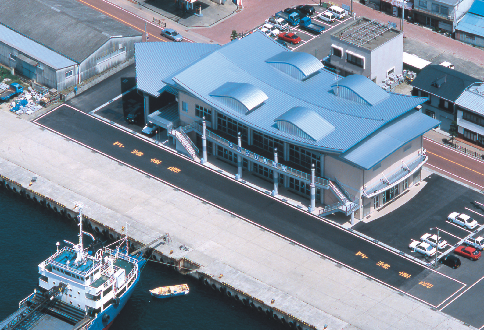
マリンバル者岐（長崎県）／工法：ハーバーストロングルーフ385