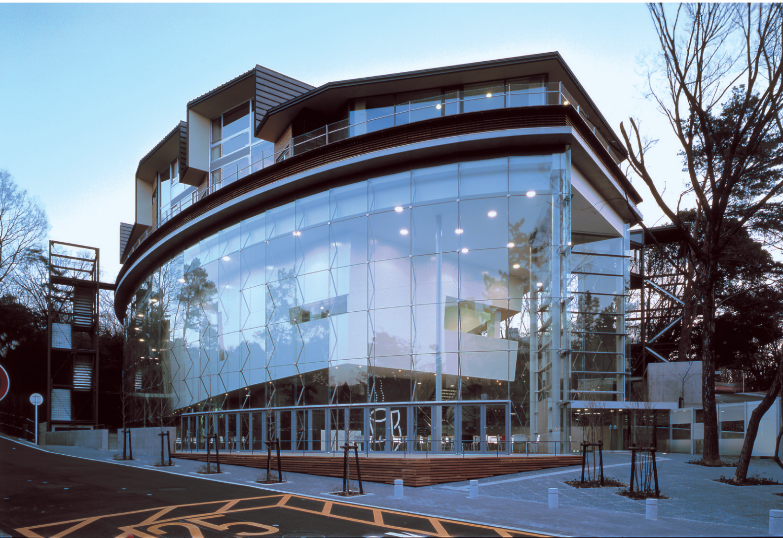
名古屋大学 野依記念学术交流館（愛知県）／工法：ハーバーストロンググループ特注型