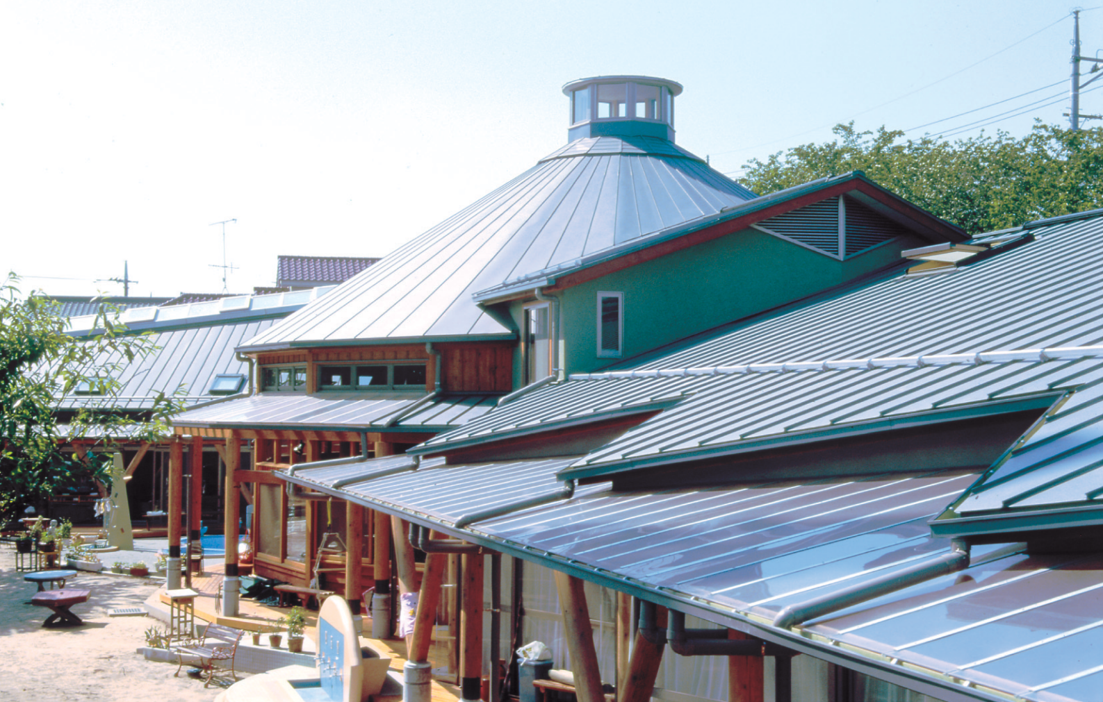
まつぶし幼稚園（埼玉県）／工法：ハーバーストロンググループ特注型