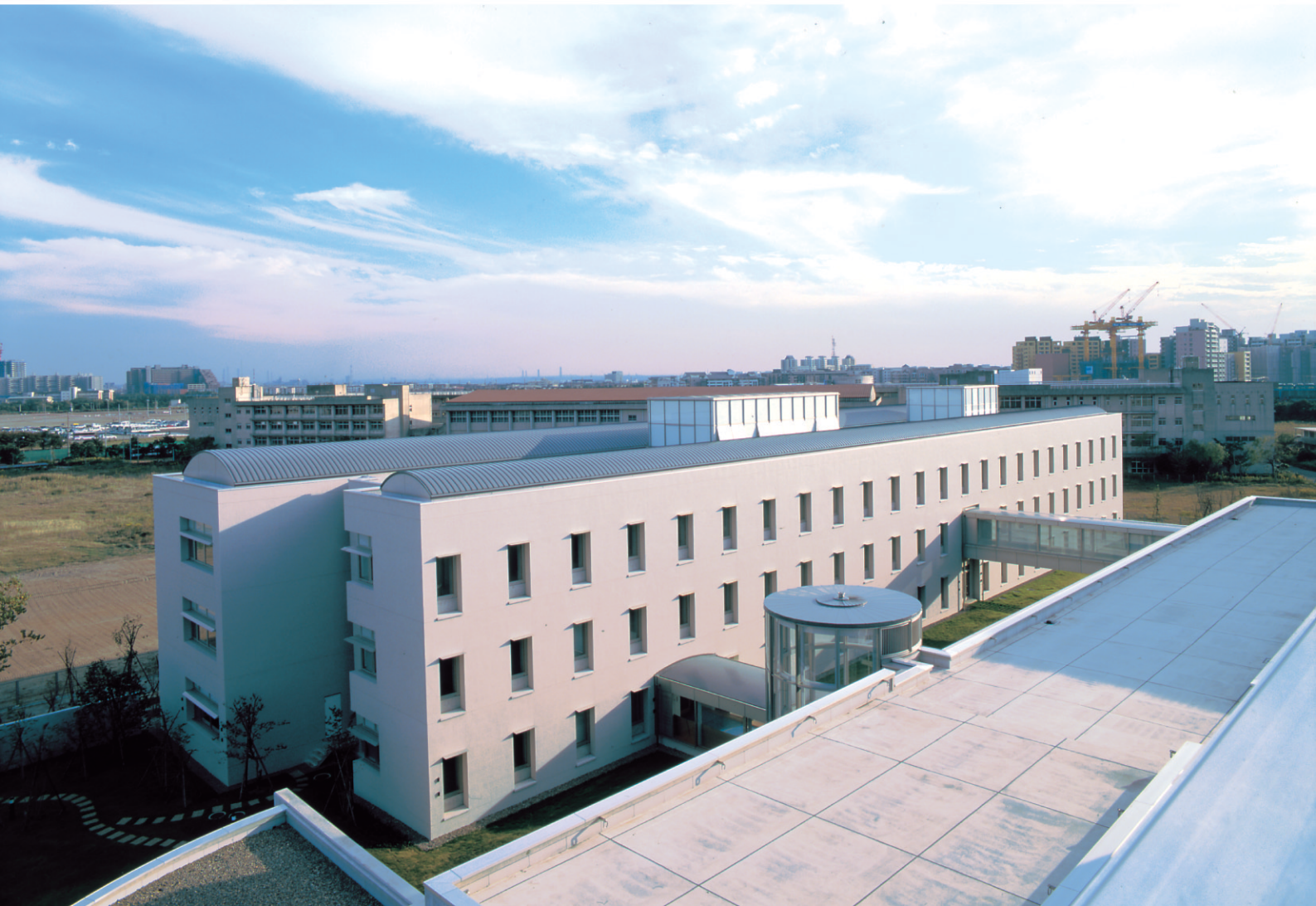
アジア経済研究所（千葉県）／工法：ハーバーストロングルーフ385