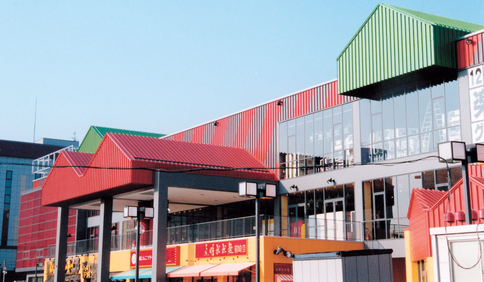
楽市街道ワイドレジャー（福岡県）／工法：ハーバーストロングルーフ300 大宮広域聖苑（茨城県）／工法：ハーバーストロングルーフ385