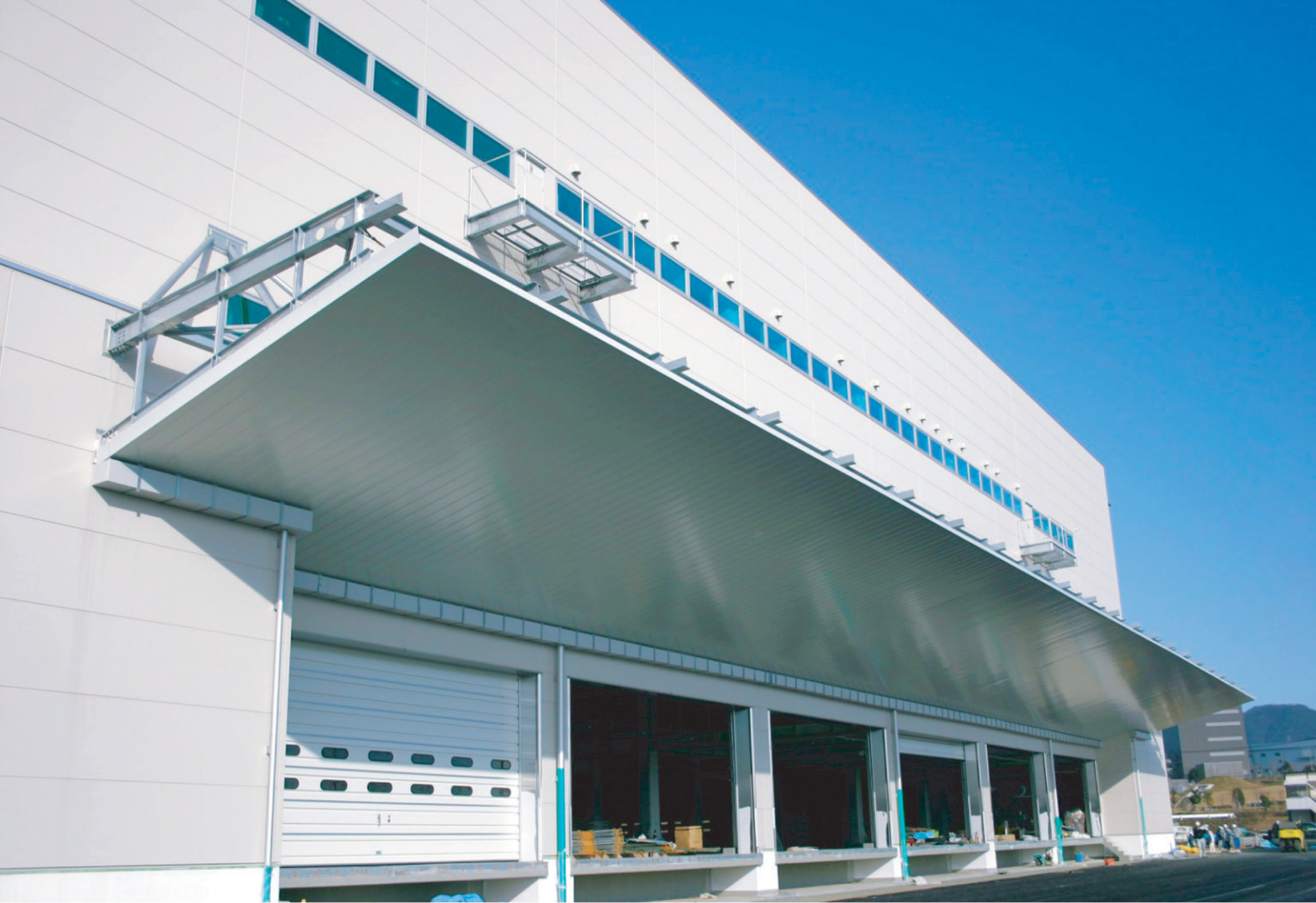
日本生協連 九州物流センター（福岡県）／工法：ハーバーストロングルーフ300C