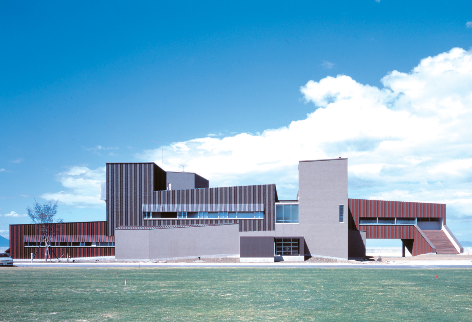
宇土マリーナハウス（熊本県）／工法：ハーバーストロングルーフ300