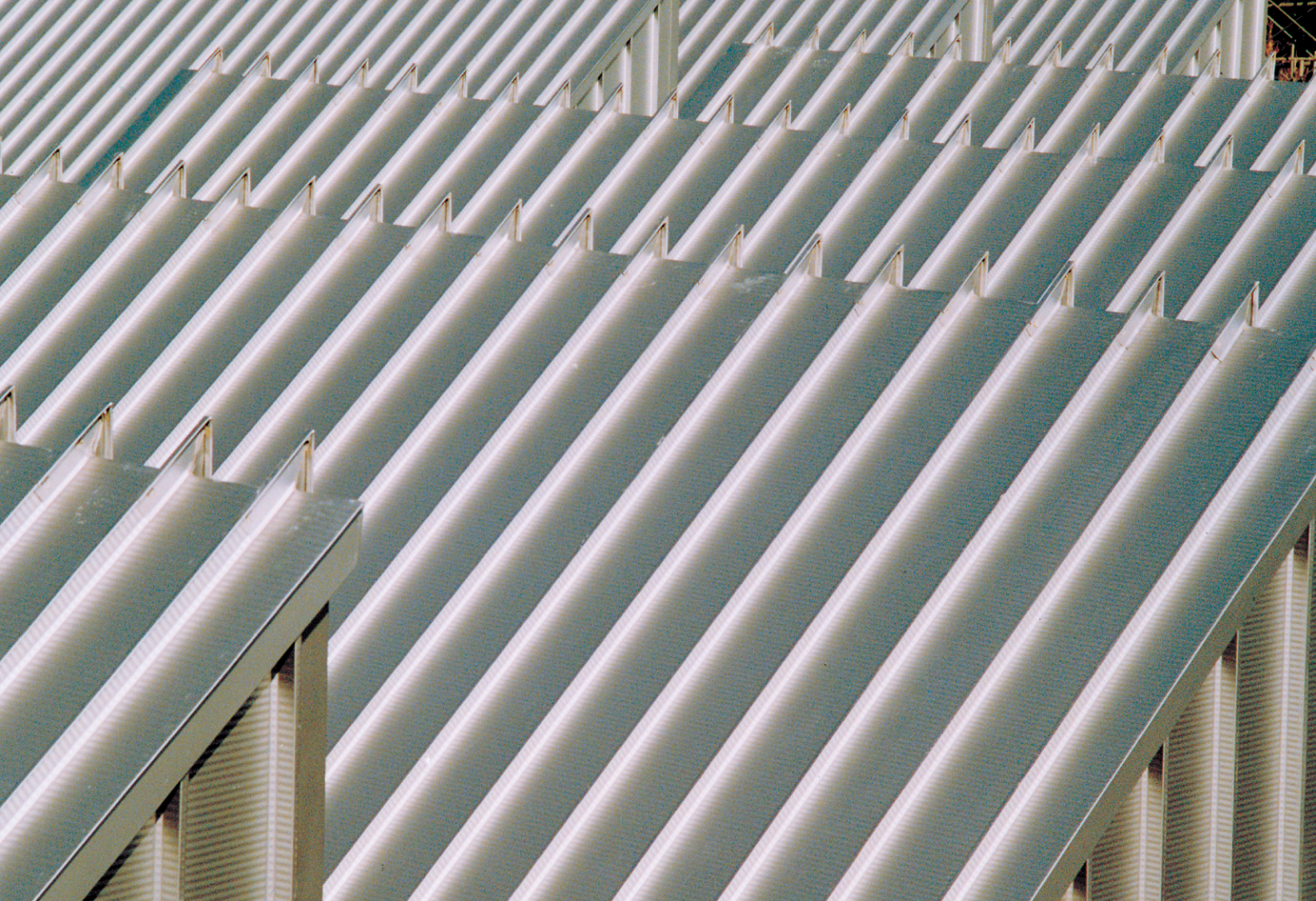
横須賀総合高等学校（神奈川県）／工法：ハーバーストロングルーフ300・385