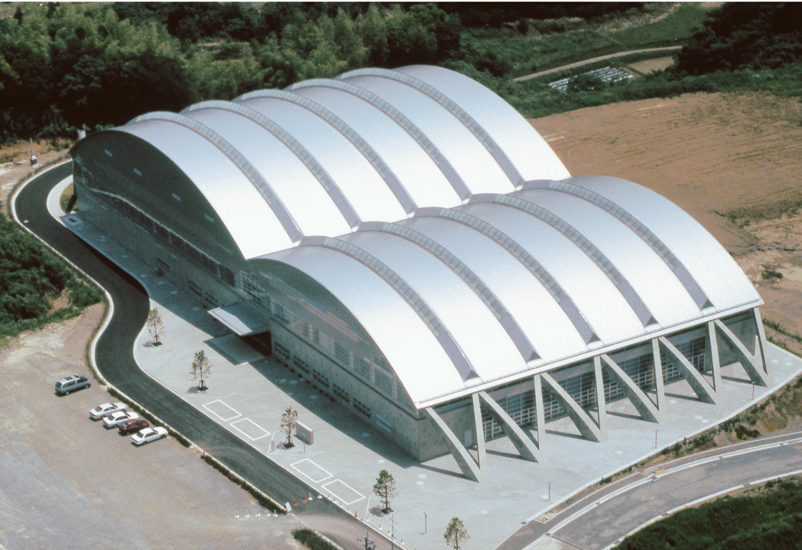
菊池市総合体育館（熊本県）／工法：ハーバーストロングルーフ385