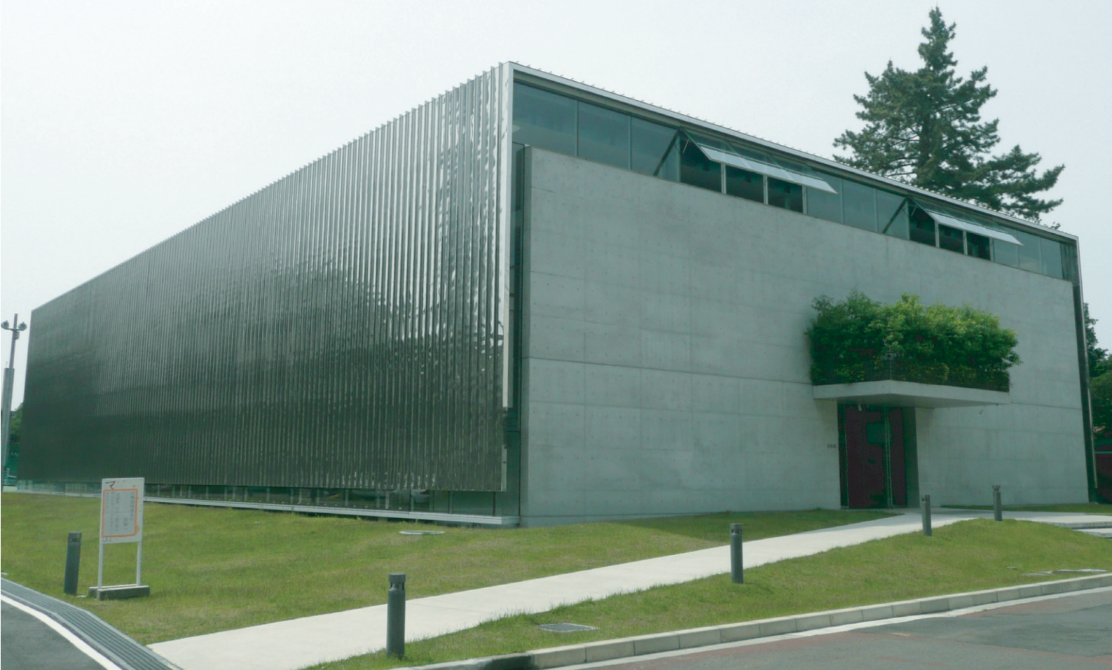
相模女子大学 新体育館（神奈川県）／工法：ハーバーストロングループ300