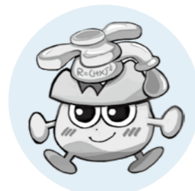
市上下水道部キャラクター すいどん

止水栓を閉め、水を止めましょう。止水栓が見つからない場合は、布テープなどでいったん穴をふさぎ、市指定の水道業者に修理を依頼しましょう。 訪問した事業者が、漏水以外の工事を勧め高額の請求になる場合があります。本当に必要な修理なのか、確認して契約しましょう。 詳細は問い合わせるか市ホームページをご覧ください。