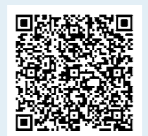
「さんあ〜る」のダウンロードはこちらから