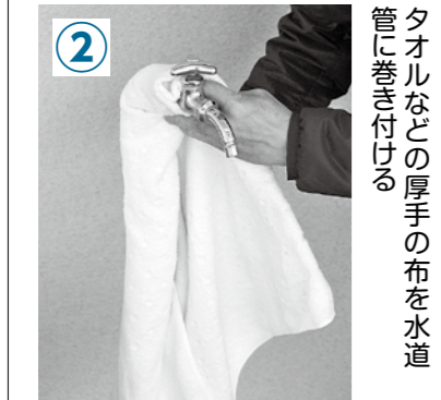
タオルなどの厚手の布を水道管に巻き付ける