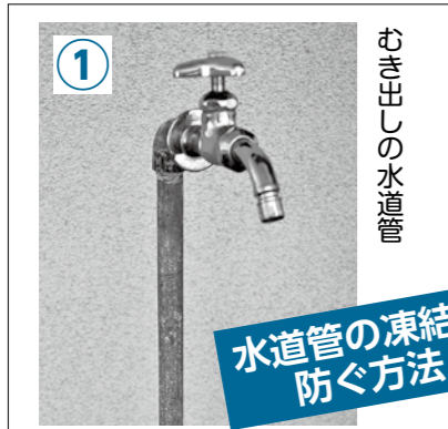
水道管の凍結を防ぐ方法

水道管の防寒対策をして、凍結による破裂などを未然に防ぎましょう。 問=上下水道部お客様センター ☎(42) 3500