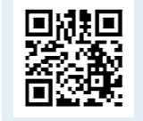
専用フォームはこちら

特定健診の未受診者を対象とした集団健診を実施します。かかりつけ医がない人や、5月から10月の受診期間中に特定健診を受けることができなかった人は、ぜひ受診しましょう。(要予約) ※各種人間ドックとの重複受診はできません。 ●受診期間Ⅱ1月25日(木)～27日(土) ●場所Ⅱ国分保健センター ●対象Ⅱ40歳以上75歳未満の国民健康保険加入者のうち特定健診未受診者 ●受診料Ⅱ無料