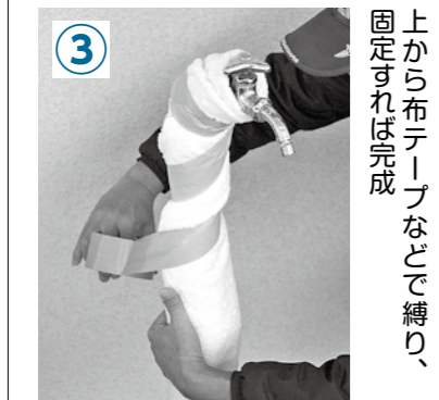
上から布テープなどで縛り、固定すれば完成