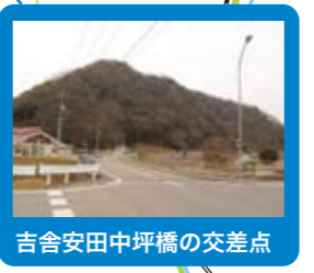
吉舎安田中坪橋の交差点