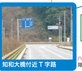
知和大橋付近T字路