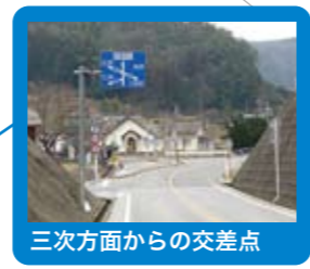
三次方面からの交差点