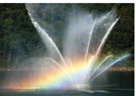
ハイツカ湖の噴水

■ル・サンク 添加物を使わない素朴な味わいが人気のパン屋です。 国内産小麦を自家製天然酵母で発酵させ、石窯で焼き上げます。 庄原市総領町五箇289 0824-88-7937