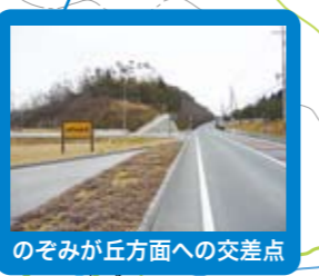
のぞみが丘方面への交差点