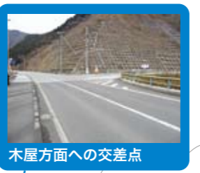
木屋方面への交差点