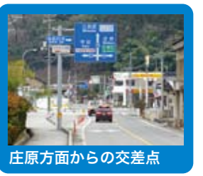
庄原方面からの交差点

■ハイツカ湖畔の森 地元食材を多用したこだわり料理が楽しめるカフェレストランです。宿泊できるコテージや遊具、テニスコートや陶芸学習舎も併設。 三次市三良坂町仁賀563 0824-44-3770