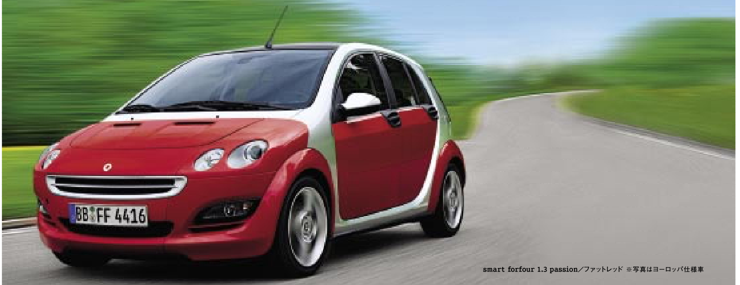
smart forfour 1.3 passion/ファットレッド ※写真はヨーロッパ仕様車