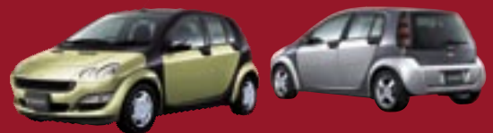
Photo: 左より smart forfour 1.3 [ボディカラー:メロングリーン (オプション)], smart forfour 1.5 [トリディオンセーフティセル:チタニウムグレー/ボディカラー:スターライトシルバー (オプション)]

心躍るスポーティな走り、ゆとりある室内空間のスマート フォーフォーに、15インチアルミホイールやパノラミックガラスルーフ、本革巻ステアリングなどを装備した1.3 パッション新登場。ヤナセ 稲毛支店で、その魅力をお確かめください。