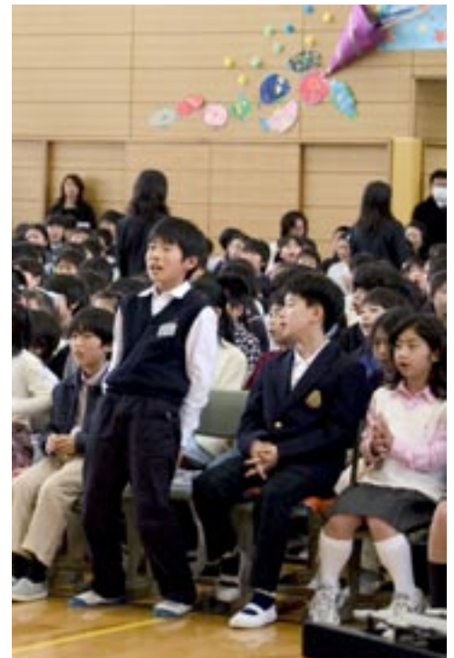
卒業式場でちゃんちゃんコールを熱唱する在校生

先生も予想していなかったという。今では替え歌を考えるようにさまざまなちゃんちゃんコールがあり、1年生も自分たちのコールを持っているという。恐らく子どもたちは海浜打瀬小学校独自の文化のようなものをこのエールに感じているのだろう。開校してまだ4年の海浜打瀬小学校だが、伝統というにふさわしいものが確実に育っている。【松村】