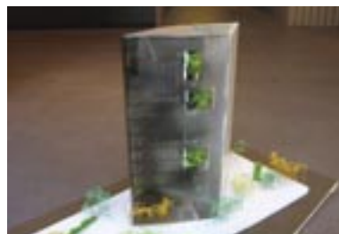
川口英俊賞 村木 計