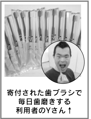
寄付された歯ブラシで毎日歯磨きする利用者のYさん↑

私もあきる野市で働く市民として、皆さんと同じように「地域のため、人のため」にできることを、これからも続けていきたいと思えます。