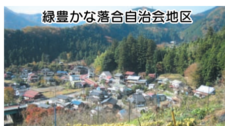
緑豊かな落合自治会地区

しお話してくださいます。 原自治会長は笑顔で いきたいです。秋 治会活動の心掛け 発になるような、自 ユニケーションが活 地域住民間のコミ 孤立から守るため て、自治会の人々 の作業や行事を通 ていきます。地域 帯がだんだんと増 高年齢世帯や単身 して、これから、 このことだと思 かっているからこ 人々の顔と状況 きるのも住んで ていることを大 するを大切に ています。これ かっているから 人々の顔と状況 かっているから このことだと思 今後の取り組み して、これから、