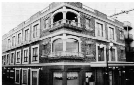
精神障害者福祉ホーム 〔ひびあらた〕 ヨーロップ風の外観です。