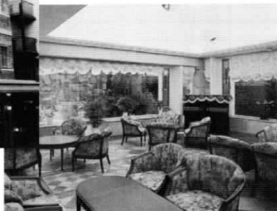
施設内のラウンジ