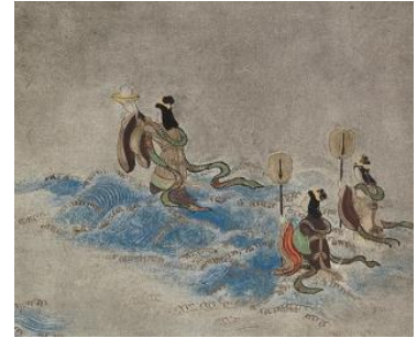
平家納経 提婆品 (模本)