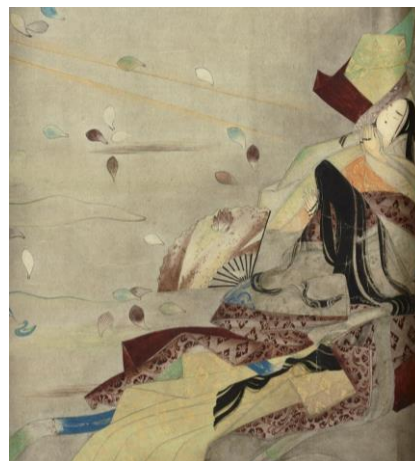
平家納経 嚴王品（模本）