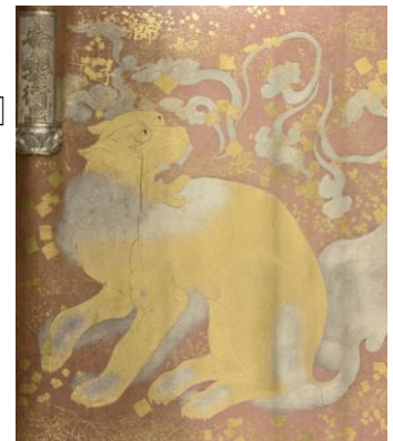
平家納経 安楽行品（模本）