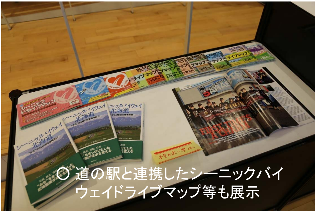
○ 道の駅と連携したシーニックバイウェイドライブマップ等も展示