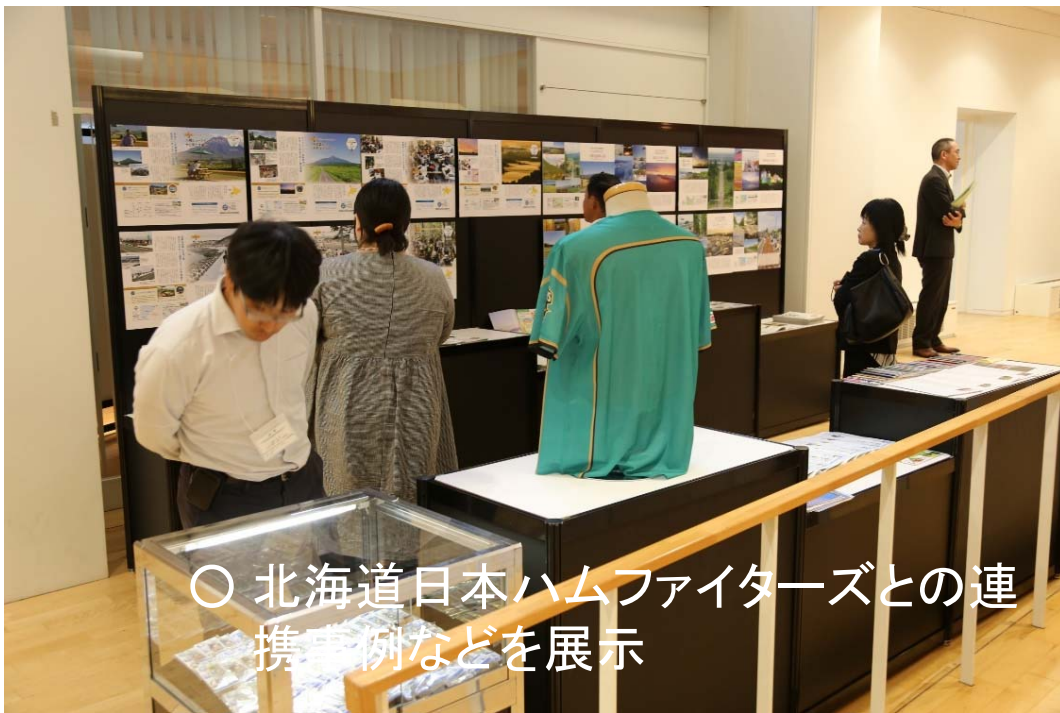
○ 北海道日本ハムファイターズとの連携事例などを展示