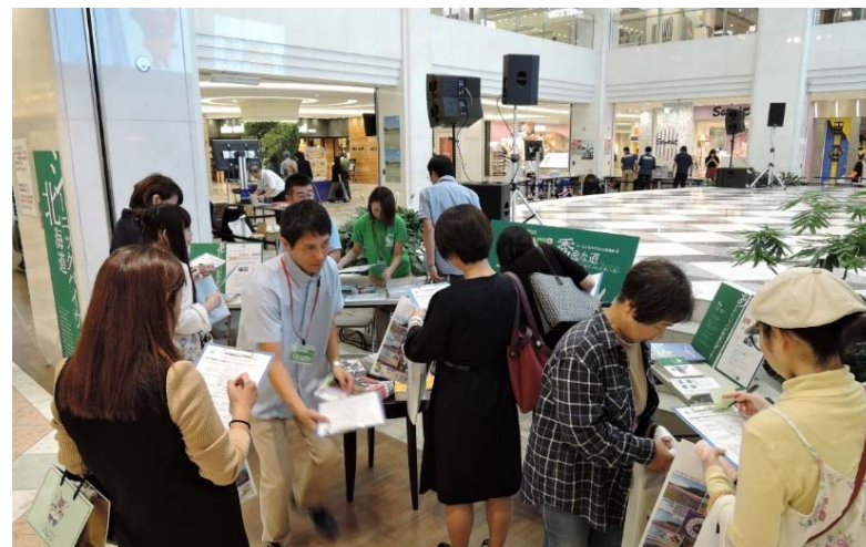
サンシャインシティ(池袋)で開催された北海道フェアでのPR