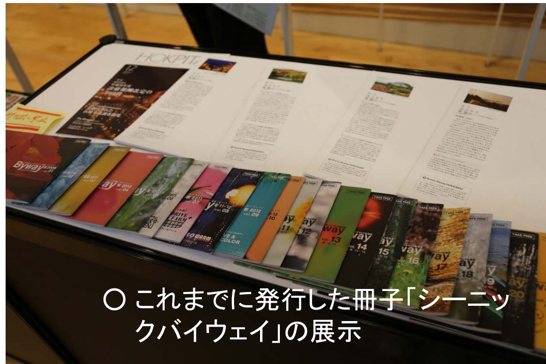
○ これまでに発行した冊子「シーニックバイウェイ」の展示