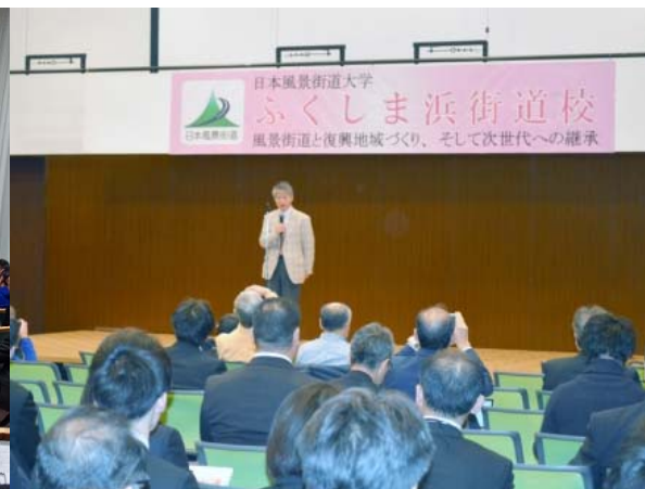
ふくしま浜街道校