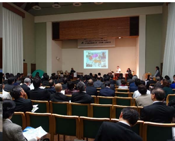
白川郷・五箇山校