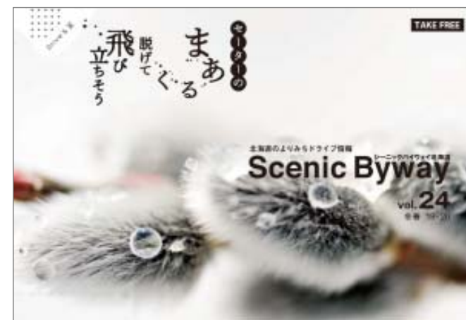
毎号テーマに沿って、各ルートを紹介する冊子「シーニックバイウェイ」(年2回発行)