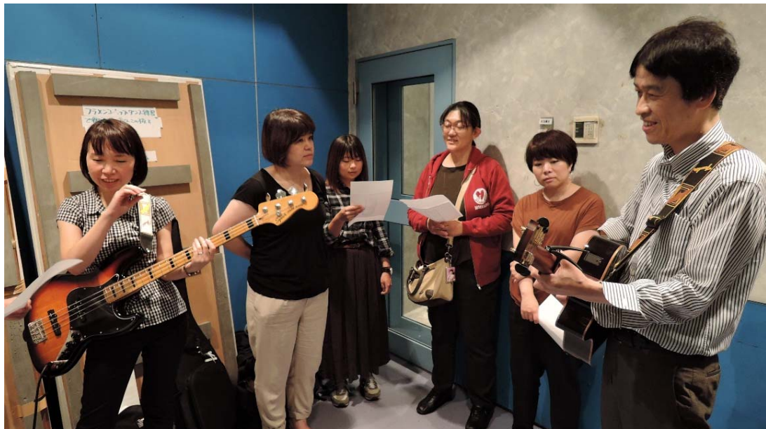
合同リハーサル@琴似パトス(19/09/13)