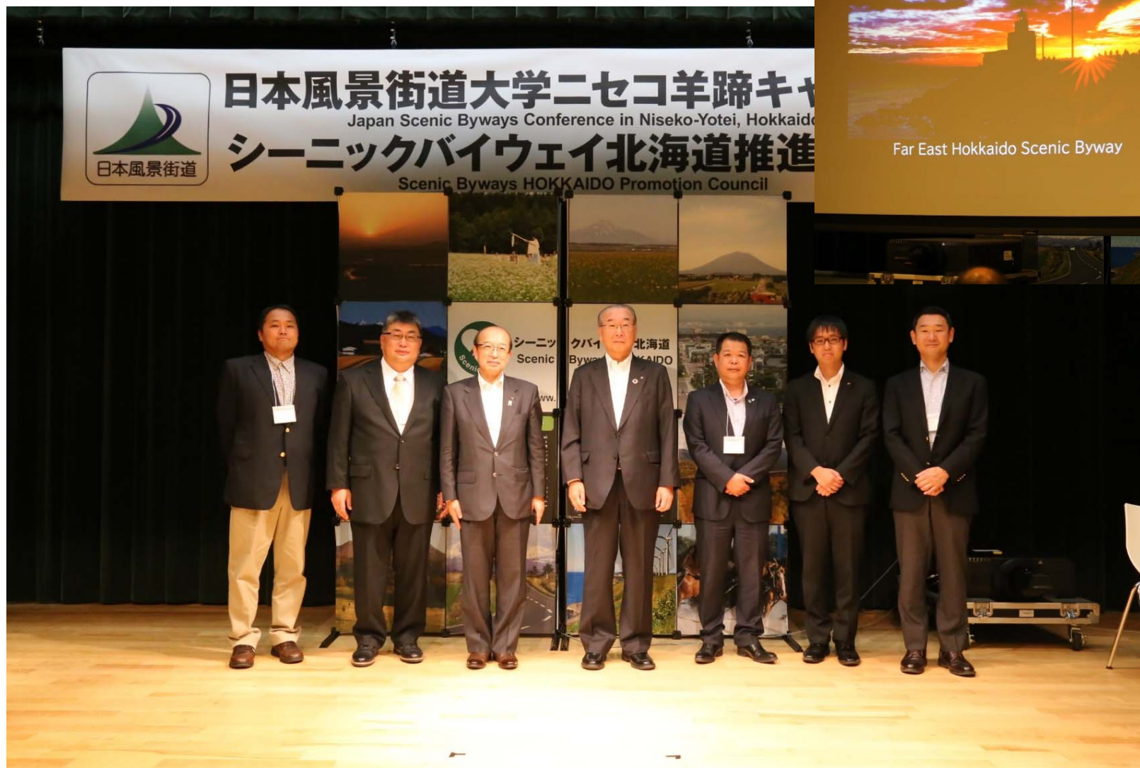
▲「知床ねむろ・北太平洋シーニックバイウェイ」のプレゼンテーションの様子