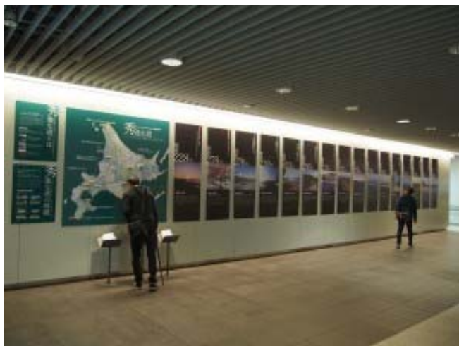
札幌地下歩行空間での美しい風景パネルの展示