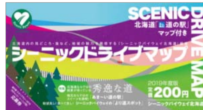
道の駅とシーニックバイウェイ全道地図「シーニックドライブマップ」