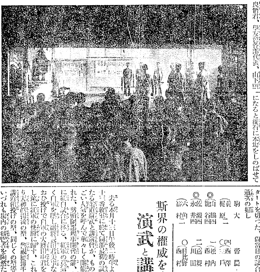
新土儀の完成と共に 學長を導師に仰ぎ