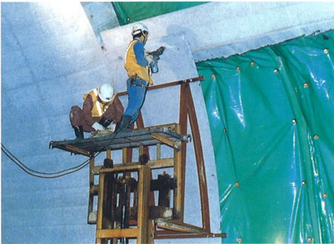
● 下部PCL版の据付状況