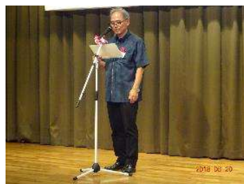
沖縄県 仲村村づくり計画課長