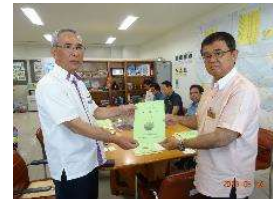
宮古農林水産振興センター ↑ ↓