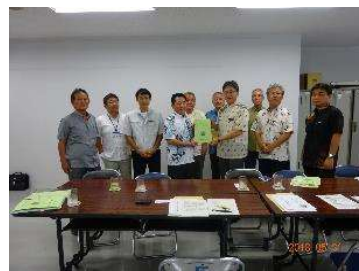
中部農林土木事務所