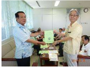
八重山農林水産振興センター ↑ ↓