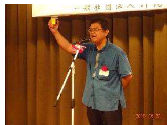
宮古農林水産振興センター 大村所長