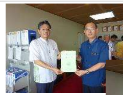
沖縄県農林水産部