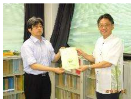
土地改良総合事務所