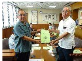
宮古島市農林水産部