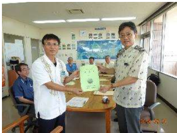
北部農林水産振興センター