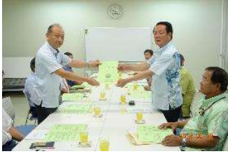
石垣島農業水利事業所 ↑ ↓