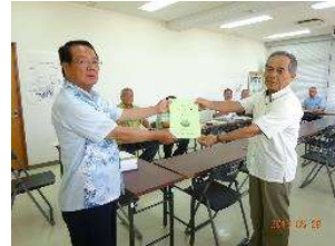
石垣島土地改良区 ↑