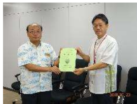
沖縄総合事務局農林水産部