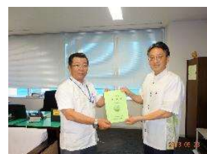
沖縄県南部農林土木事務所