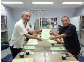
宮古伊良部農業水利事業所及び土地改良総合事務所宮古支所 ↑ ↓