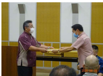
名嘉代表取締役副社長