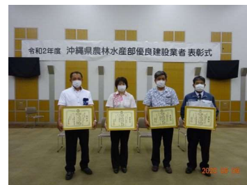
宮古地区の受賞者