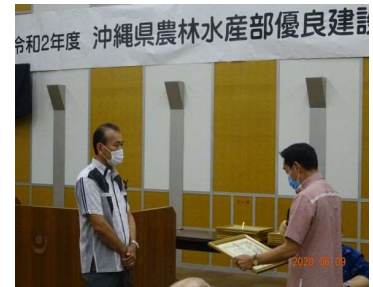
桃原代表取締役(大友建設)