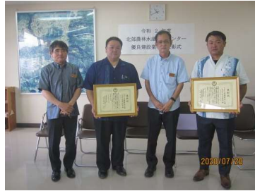
左より新城所長、安護代表取締役、 高原課長、末吉氏