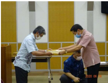
比嘉監理技術者(屋部土建)