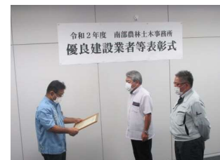
安岡 建設 (株)