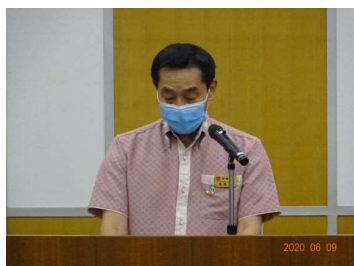
長嶺農林水産部長