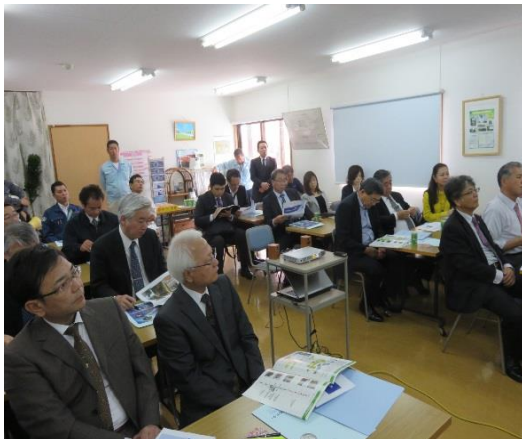
熱心に説明を聞く会員