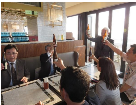
（おしゃれにビール瓶で乾杯）