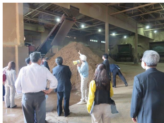
(機械によりチップに細断された廃材)