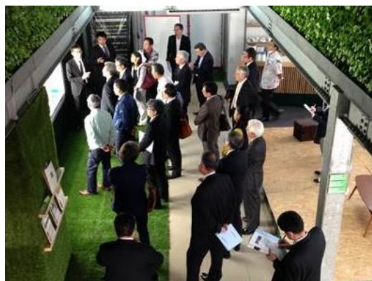
（植物工場を視察する会員）