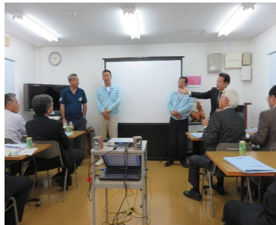
左から前堂社長、仲村部長、知念常務