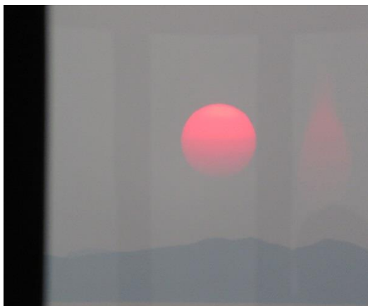
（見事なまでの夕焼け）