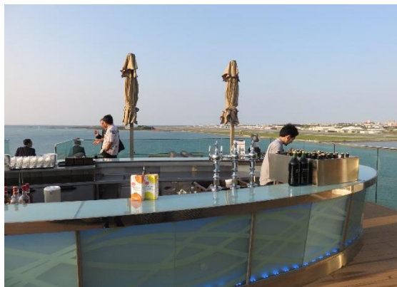
屋上のカウンターバーからの絶景も最高