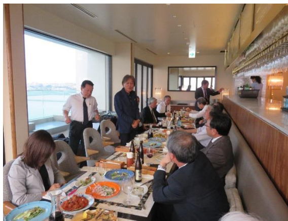
（懇親会会場をご紹介いただいた外間委員）