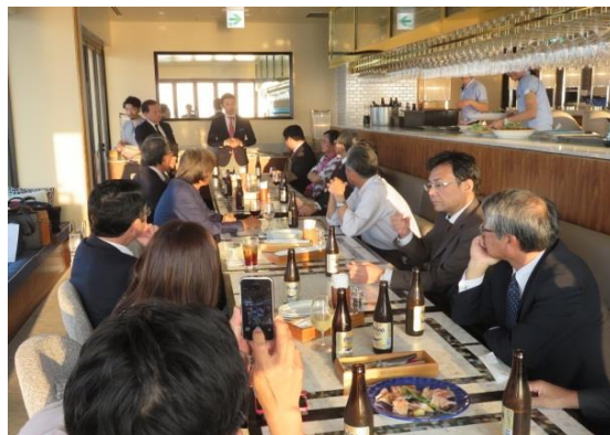
（美味しい食事とともに各人が挨拶）