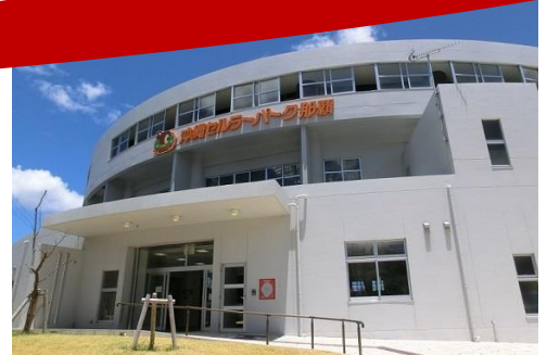
沖縄セルラーパーク那覇 (沖縄県那覇市奥武山42-1)