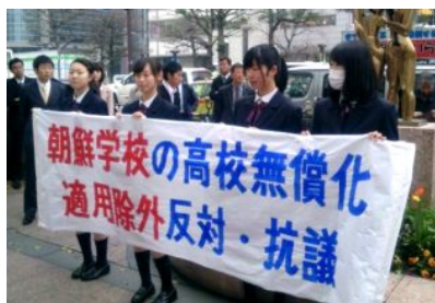
街頭での署名活動

…朝鮮学校で学ぶ私たちにも、日本の学校の生徒と同様に学ぶ権利があることを分かっ てもらいたいと思っています。