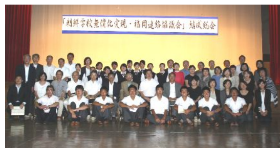
結成総会を終えて決意も新たに