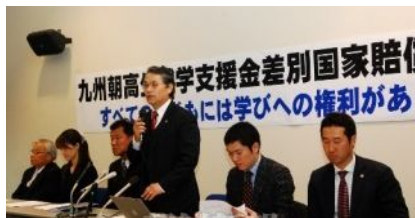
訴状を提出した後に行われた報告集会及び記者会見

…朝鮮学校で学ぶ私たちにも、日本の学校の生徒と同様に学ぶ権利があることを分かっ てもらいたいと思っています。