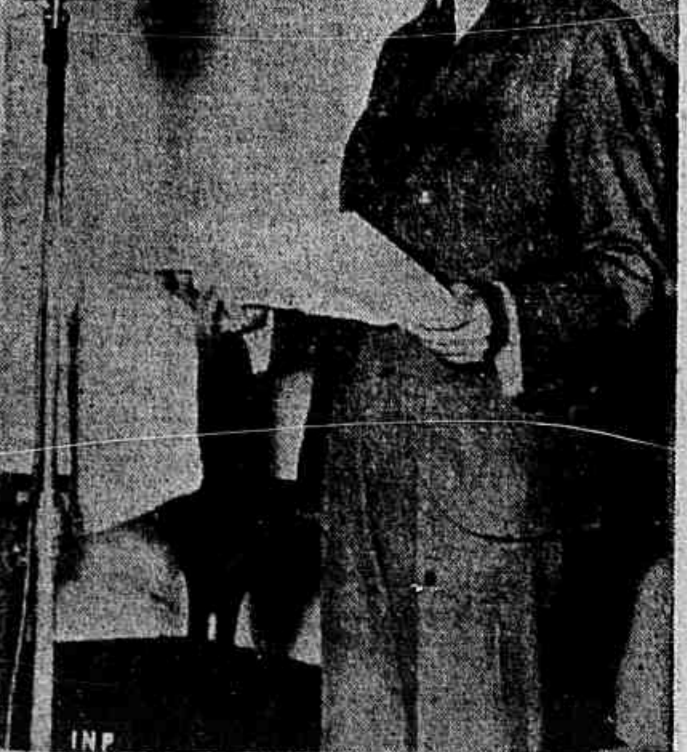
Pela segunda vez o imperador Hirohito foi procurar o general Mas Artur, em seu quartel general, com ele conferenciando sobre os problemas japoneses. Da última vez para tratar da grave situação alimentar que o país enfrenta, tão grave que obrigou o imperador a por-se diante de um microfone a fim de dirigir um apelo a todos os japoneses para que cooperem na campanha de economia e melhor distribuição dos alimentos disponíveis. A foto mostra Hirohito quando lia seu apelo pelo rádio

Coube a iniciativa dessa nova consagração ao grande poeta (Conclui na 2.ª página)