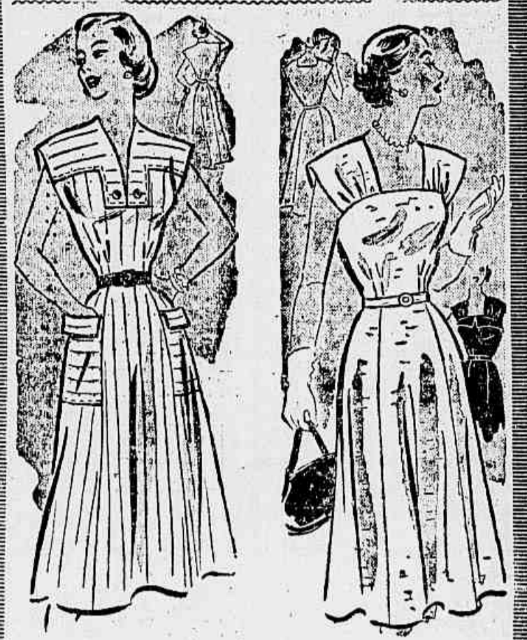
PARA MOCINHA. — Em tecido lustrado, tem a novidade de serem as mangas bem largas e feitas com o tecido invertido ao reto. Os dois botões também têm as listras horizontais. BRANCO. — Em tecido branco, tem um decote quadrado e a saia um pouco larga. Não tem mangas.