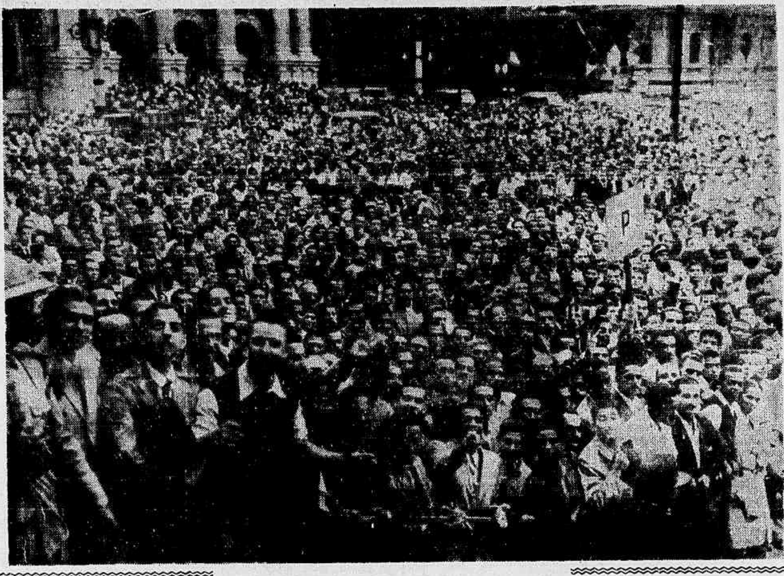
VIBRAÇÃO POPULAR — Manifestação popular nunca vista, verificou-se ontem à tarde, por ocasião da chegada, dos «cracks» campeões panamericanos, ao Rio. Ao longo das avenidas Brasil, Presidente Vargas, Rio Branco e Beira-Mar, da Cinelândia e no próprio Galeão, via-se um público numerosíssimo. Na Cinelândia, a manifestação foi qualquer coisa de impressionante. No Palácio Guanabara, o povo invadiu os jardins para abraçar os campeões panamericanos. Na Câmara dos Vereadores, o entusiasmo chegou ao auge quando falaram vários jogadores e dirigentes. Nas ruas a vibração popular foi maior. Multidão incalculável, como se vê na gravura acima, vibrou de entusiasmo vivendo os campeões das três Américas, de cujo regresso damos amplo noticiário em nossa página esportiva.