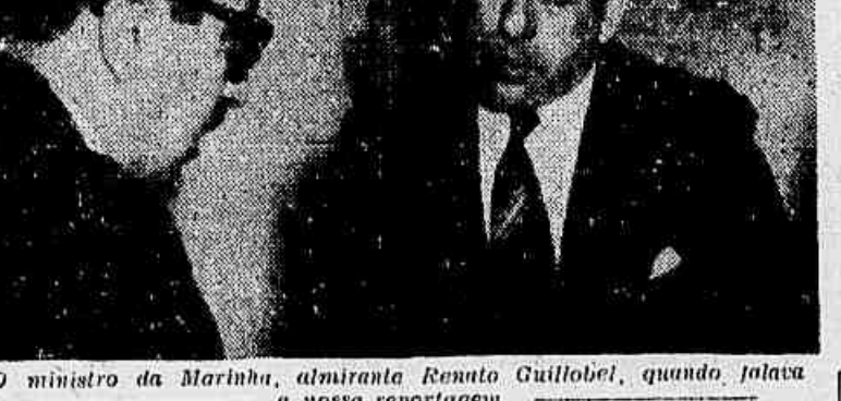
O ministro da Marinha, almirante Renato Guillobel, quando falou a nossa reportagem.

NACIONALISTA A SOLUÇÃO PROPOSTA PELO GOVERNO Afirmado ser nacionalista a solução proposta pelo governo para a exploração do petróleo, assegurou o ministro Renato Guillobel: «Vem-se, nos últimos tempos, abusando do verdadeiro significado da palavra nacionalismo, deturpando-a sob pretexto para servir a interesses que não são exatamente nacionais e procurando fazer crer sejam anti-brasileiras iniciativas as mais patrióticas. A solução proposta atende aos interesses nacionais. O governo, com maior ou menor rapidez, dita a política de petróleo, acelera a sua exploração e pesquisa com largueza de recursos e assegura no vital interesse da defesa nacional.» DECISÃO URGENTE — O que é necessário, no momento — disse, finalmente, o ministro da Marinha — é acelerar a solução de tão palpitante problema. De nada adianta o projeto, por melhor que seja, se não se «lugar rapidamente» a sua decisão. E é isto que esperamos com ansiedade: interesses vitais da defesa nacional tornam imperativa e urgente a solução do problema de petróleo, como a solução de um problema de guerra, isto é, de um problema de defesa nacional.