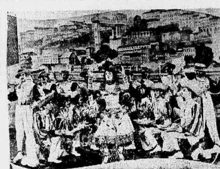
MARIA ANTONIETA PONS, como aparece numa cena de "A Rainha do Mumbo", cantando a canção de Ari Barroso...