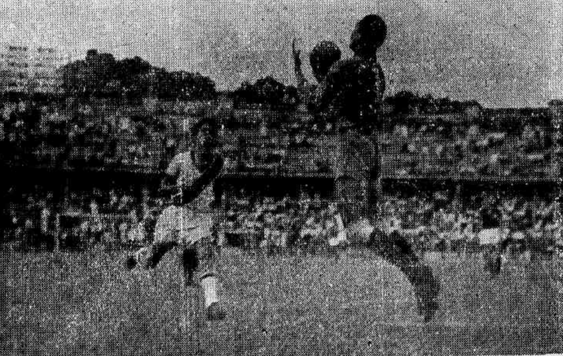
Uma defesa do guarda-lua Garcia durante a defesa rubro-negra. Em face da recuperação verificada na equipe rubro-negra, a luta de hoje com o Olaria tem o clube da Gávea como favorito.

Será seu adversário o Olaria, com quem empatou no turno