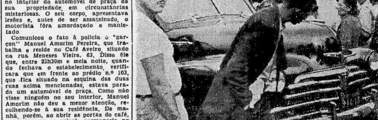
O automóvel de "Pard" cercado de curiosos, no local onde foi encontrado

Foi estrangulado o motorista no seu próprio automóvel — Tudo indica tratar-se de latrocínio — Detalhes do crim e ocorrido em Todos os Santos