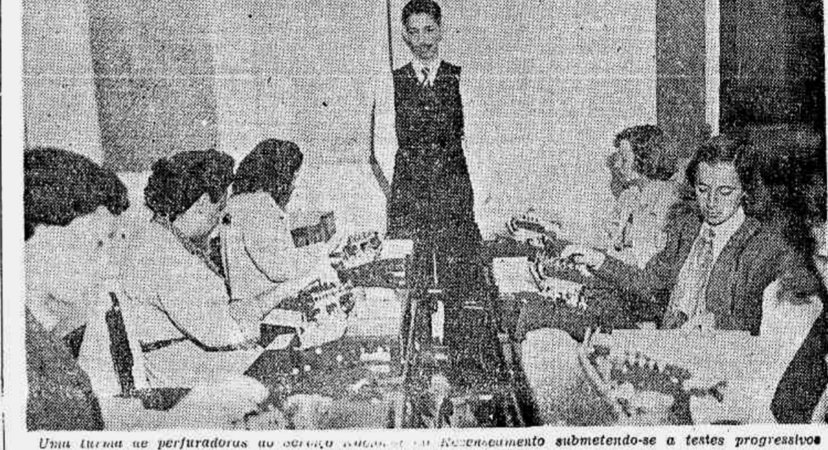
Uma turma de perfuradoras no estágio regulamentar do Recenseamento submetendo-se a testes progressivos para a classificação final.

Reuniu-se, pela última vez, a Junta Executiva Central do Conselho Nacional de Estatística, tomando conhecimento das atividades censitárias no país — Prossegue a coleta no interior