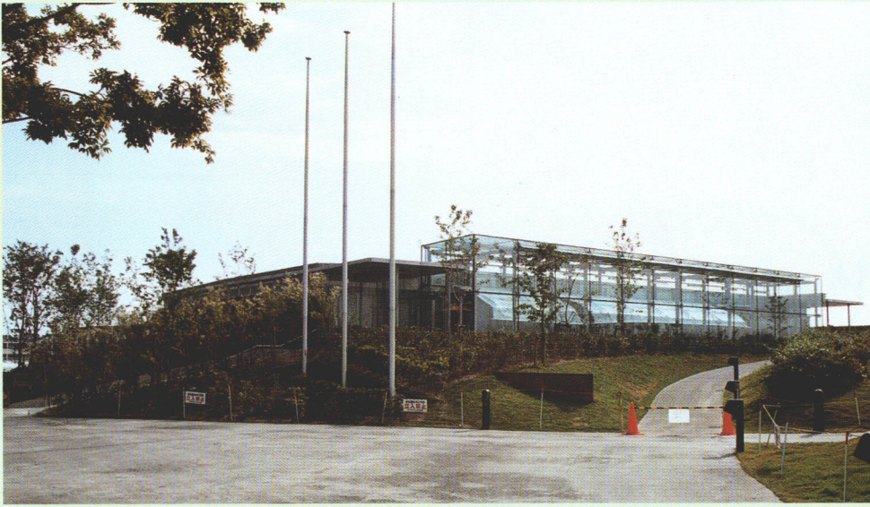
▲6月15日にオープンした水生生物保全センター Center for Conservation of Aqua-Life that opened on June 15.

六月十五日に水生生物保全センター（Center for Conservation of Aqua-Life: CAL）がオープンしました。CALは、こわれやすい水辺の自然を保全する役割を中心に、飼育の難しい生物の飼育技術開発、繁殖研究、野生生物の保護活動