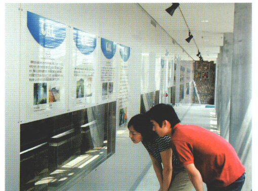
▲観覧通路 Exhibition passage